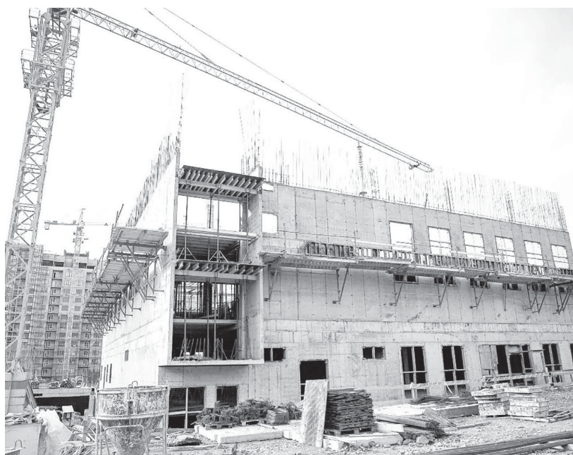
■ В ГОРОДЕ активно идет строительство