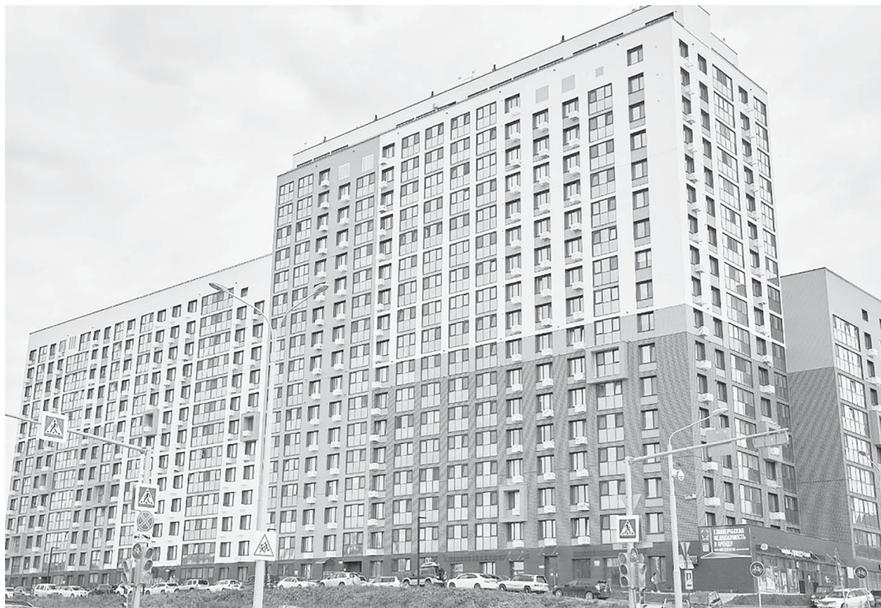
■ ОБЛАСТНОМ ЦЕНТРЕ украсили новые стильные многоэтажки

♦ Накануне новогодних праздников в резиденции Деда Мороза прошел утренник для детей сахалинцев, принимающих участие в СВО. Вместе с Дедом Морозом, Снегурочкой и другими героями сказок дети водили хороводы, танцевали и играли. Самому младшему гостю было 2 года, старшему - 15. Отцы многих ребят мобилизованы, а их мамы объединились и поддерживают друг друга. К проведению праздника также подключились волонтеры профсоюза "Сахалин за наших". Они постоянно оказывают помощь бойцам в зоне проведения СВО и поддерживают их семьи. Всех участников представления ждали подарки, для детей состоялся мастер-класс по изготовлению снеговика. Департамент социальной политики администрации Южно-Сахалинска проводит консультации по всем вопросам для членов семей бойцов СВО. Телефоны для справок: 312-710, 300-718, 300-596 . Звонки принимают с 9.00 до 17.00 в рабочие дни, перерыв с 13.00 до 14.00.