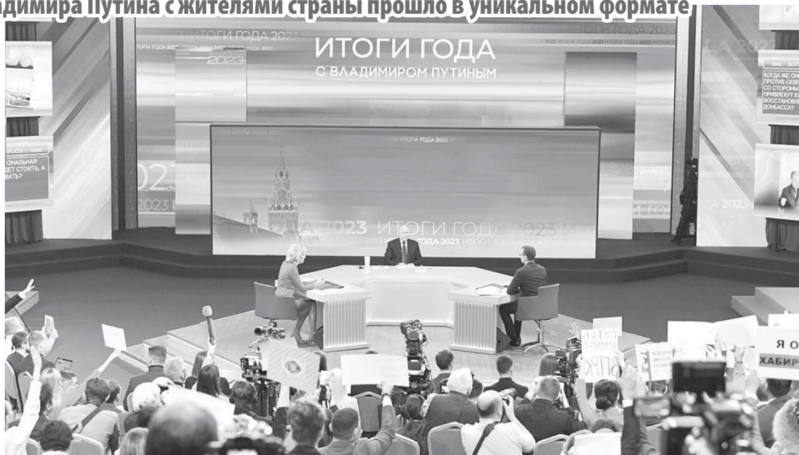
■ ГЛАВА ГОСУДАРСТВА отвечал на вопросы более 4 часов

- Существование РФ невозможно без суверенитета - одна из первых и главных мыслей, озвученных президентом. Укрепление границ, повышение обороноспособности и безопасности, обеспечение прав и свобод граждан, технологический и экономический суверенитет - это то, что позволяет нашей стране развиваться. Мы с коллегами постоянно повторяем, что наша общая цель - крепкая, сильная, единая, независимая и процветающая Россия, в которой комфортно и безопасно жить. На это направлена работа Городской Думы. По поводу экономической стабильности и благополучия наших жителей хочется отметить, что на уровне областного центра нам удалось не только не допустить кризиса, но и продолжить реализовывать важнейшие нацпроекты, инициированные Владимиром Путиным. В областном центре строят дома, скверы, школы и детские сады, ремонтируют дворы и дороги. В этом году открылся новый аэровокзал, началось строительство кампуса мирового уровня. Все это идет при