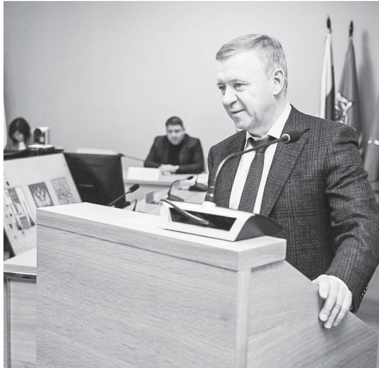
■ МЭР города обсудил актуальные вопросы с управдомами