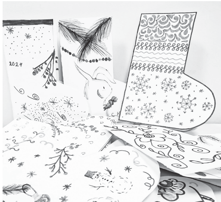
■ Для новогодних открыток каждый год выбирают разное оформление

Конечно, большинство дошколят писать еще не умеют, но зато охотно рисуют, вырезают и клеивают в открытку те подарки, которые хотели бы получить на Новый год. Затем заветные письма упаковывают в посылки и отправляют обычной почтой в резиденцию Деда Мороза в Великом Устюге.