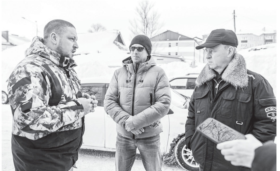
■ МЭР тщательно контролирует обстановку в городе

- Проехали по северным районам. Были в Ново-Александровске, Березняках, Новой Деревне, в том числе посетили места про-