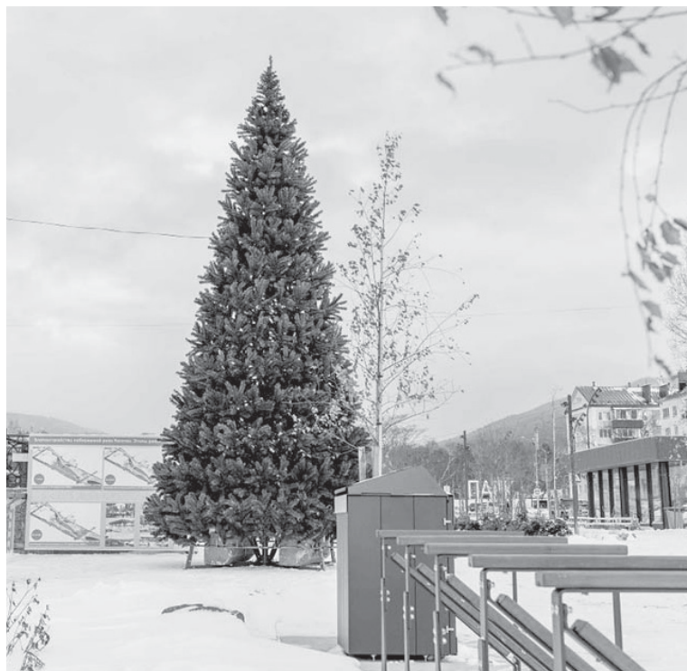
■ ПРАЗДНИЧНАЯ ЕЛКА впервые украсила обновленную набережную

В рамках первого этапа благоустроили участок от город-