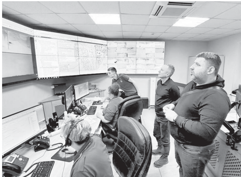
■ СИТУАЦИЯ под постоянным контролем

- Водозабор является подземным, поэтому снежный покров не влияет на его работу. Все оборудование - скважины, насосные и фильтры - исправно. Прошед-