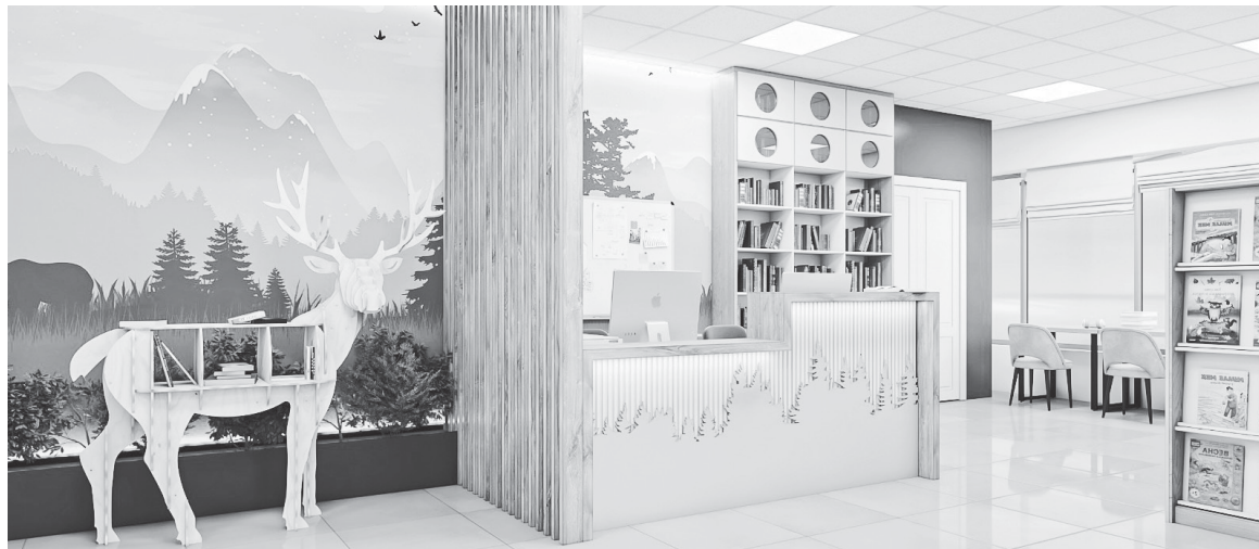
■ СКОРО библиотека наполнится читателями

- Это долгожданный подарок всем: и взрослым, и детям. Площадь нового здания в семь раз превышает прежнюю. Это и методический центр, и место, где дети разного возраста будут с пользой проводить время, - отметила министр культуры и архивного дела Сахалинской области Нонна Лаврик.