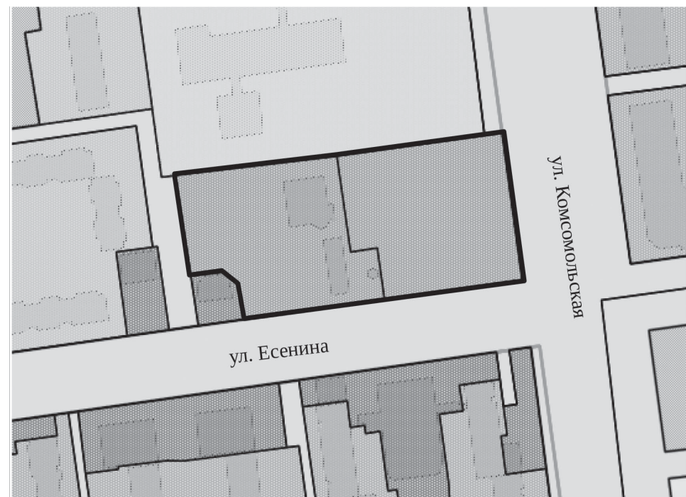
Схема границ территории

Приложение к постановлению администрации города Южно-Сахалинска от 27.04.2022 № 946-па