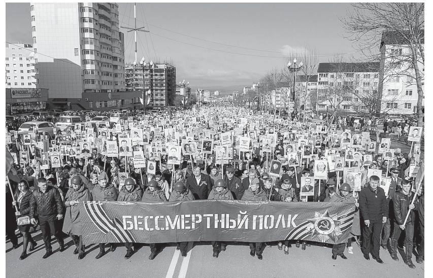
■ БЕССМЕРТНЫЙ ПОЛК - бессмертная сила!

В этом году в распространении значка примут участие активисты волонтерских организаций, Почта России, партнерские сетевые магазины «Авоська», «Мираторг» и мар-