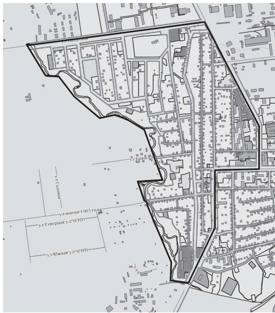
— границы проектируемой территории

Приложение к постановлению администрации города Южно-Сахалинска от 19.04.2022 № 857-па Схема границ проектируемой территории