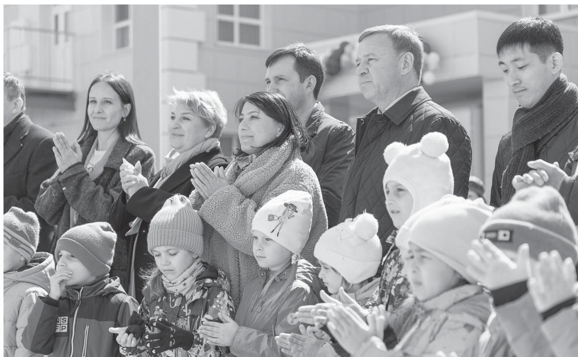
■ ОТКРЫТИЮ «ЛУКОМОРЬЯ» рады все!

Для ребят в новом детском саду открыты спортивный и му-