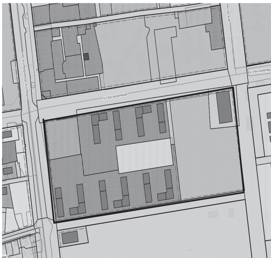
границы проектируемой территории

Приложение № 1 к постановлению администрации города Южно-Сахалинска от 20.04.2022 № 866-па Схема границ проектируемой территории