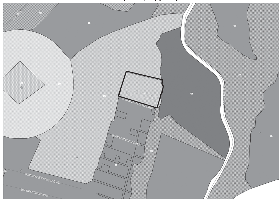
Схема границ территории

Приложение к постановлению администрации города Южно-Сахалинска от 29.03.2022 № 655-па