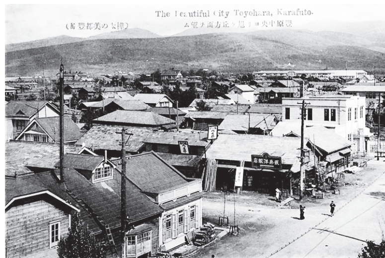
Тоёхара. Вид с 4-й улицы (ул. Хабаровская).

На сайте sakhalin.tours создали новый подраздел «Южно-Сахалинску 140».