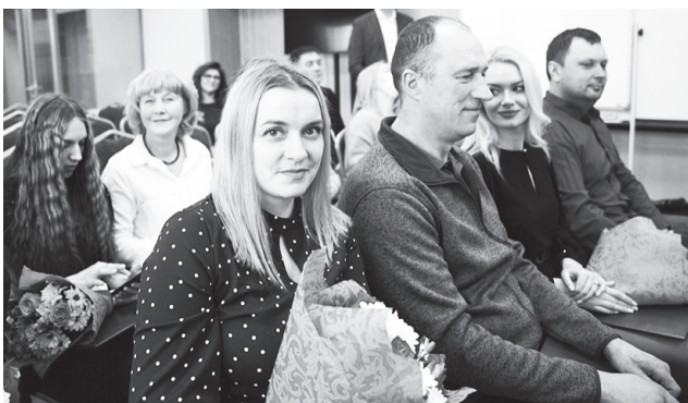
На церемонии награждения волонтеров искренне поблагодарили за помощь во время циклонов.

— В день мы отрабатывали 8-10 адресов. В Дальнем пришлось долго откапывать дом од-