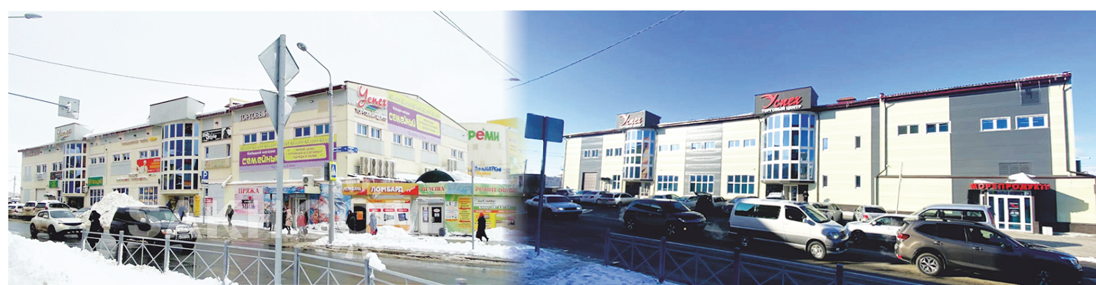
Торговый центр «Успех»: так было (слева) и так стало (справа).

Дизайн-код – определенные правила формирования стилистически единой, комфортной и привлекательной город-