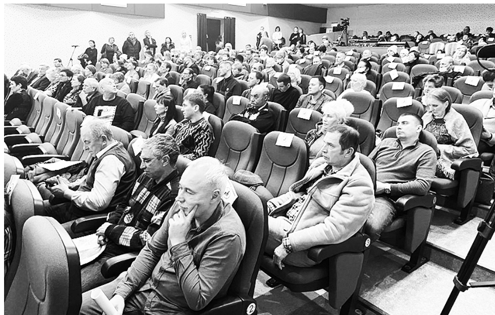
Участники обсуждения в ГДК «Родина».