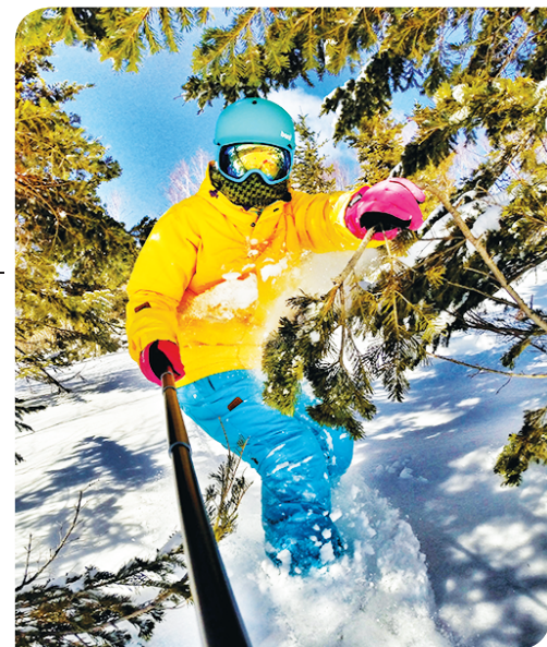
«Сноуборд дает незабываемые эмоции и разрядку».

В школу она часто надевает браслет с надписью: «Жизнь не только для работы», и старается следовать мудрому принципу.