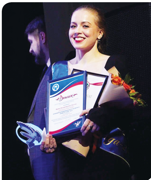
Победитель конкурса «Педагог года-2022».