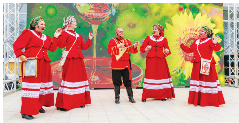
Главное предназначение «Радостей» - нести людям радость!

В Южно-Сахалинске появились первые объекты торговли, чьи фасады, витрины, входные группы и вывески обновлены на основании требований утвержденного дизайн-кода. Впоследствии собственники всех зданий в центральной части островной столицы, так называемом ядре города, должны будут привести свои объекты в соответствие с ним. При этом консультации и согласование эскизов проводятся бесплатно.