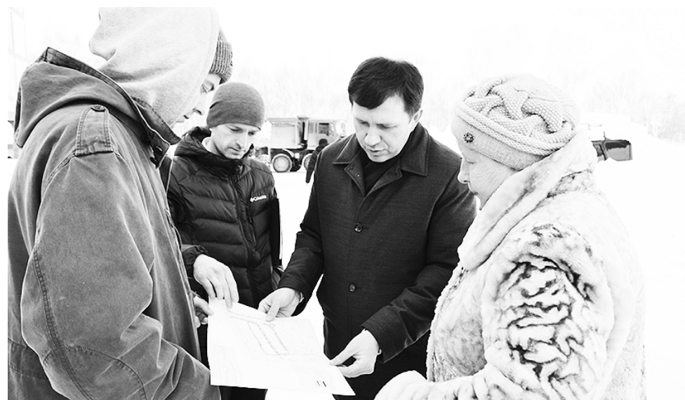
Общение с избирателями – ключевой момент деятельности народного избранника.

Особенности руководящей работы: что должен знать и уметь глава представительного органа муниципальной власти.