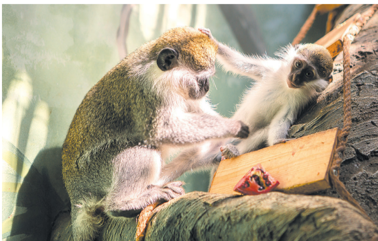
► Материнские хлопоты

Кстати, в прошлом году у носух уже рождались детеныши, и тоже трое. Они благополучно выросли и сделали весьма успешную карьеру: улетели в столицу, где прописались в качестве постоянных обитателей Московского зоопарка.