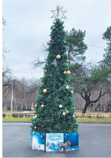
► Гости парка уже могут полюбоваться новогодней елью