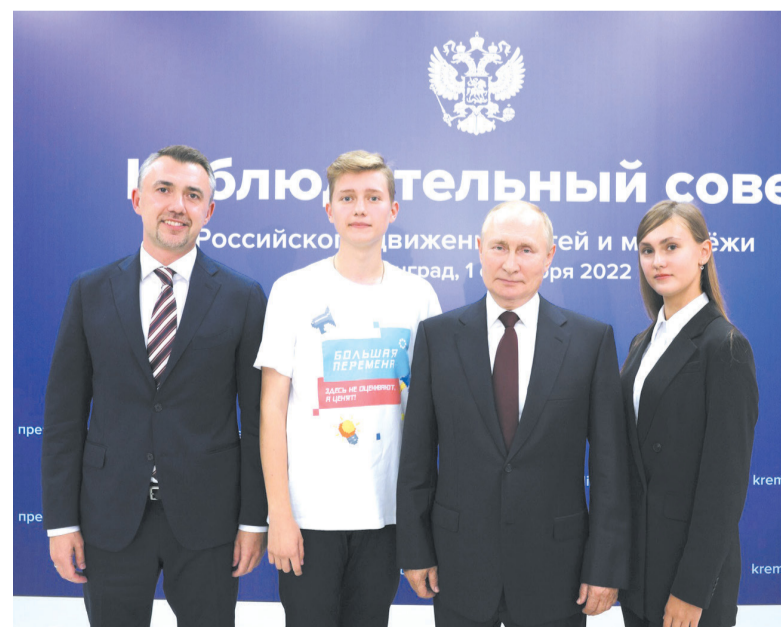
► В одном строю с президентом