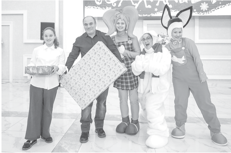
► Подарки детям

Две крупные благотворительные акции стартуют накануне Нового года в Южно-Сахалинске