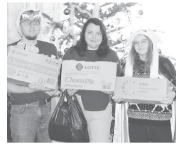
► Приходим не с пустыми руками

сладостей. Денег традиционно не просим, только конфеты, шоколадки и печенье — строго в индивидуальной упаковке, магазинные (ручной работы нельзя), без