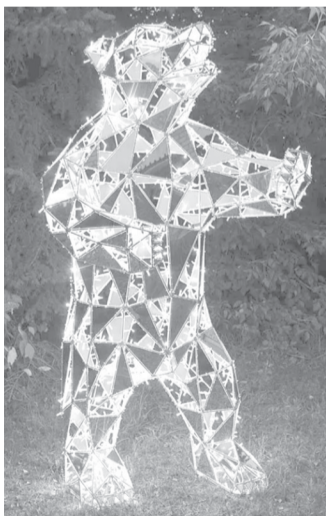
► Зеркальный медведь

— Праздничному, и в частности новому году, освещению в мастер-плане посвящен отдельный раздел. Для каждого локального общественного пространства создается уникальный сценарий.