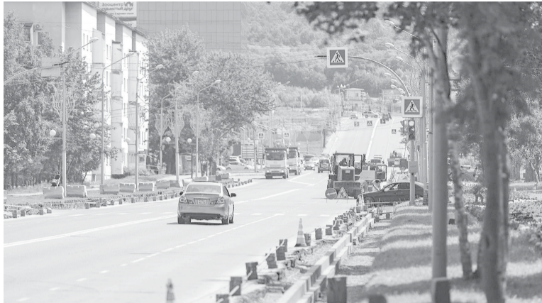
► В этом году на центральных улицах города шел масштабный ремонт

Кроме того, на участке ул. Ленина от ул. Поповича до пр. Победы построили ливневый коллектор — советские проектировщики изначально не предусмотрели этот важный объект. В 2024 году к нему подключат