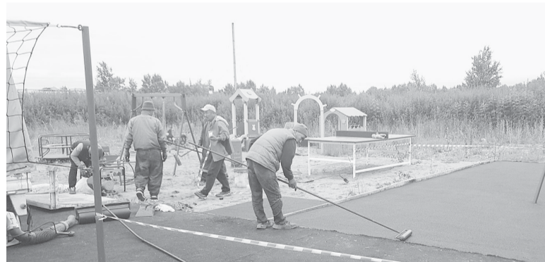
► Спортивную площадку в Лиственничном построили в несколько этапов