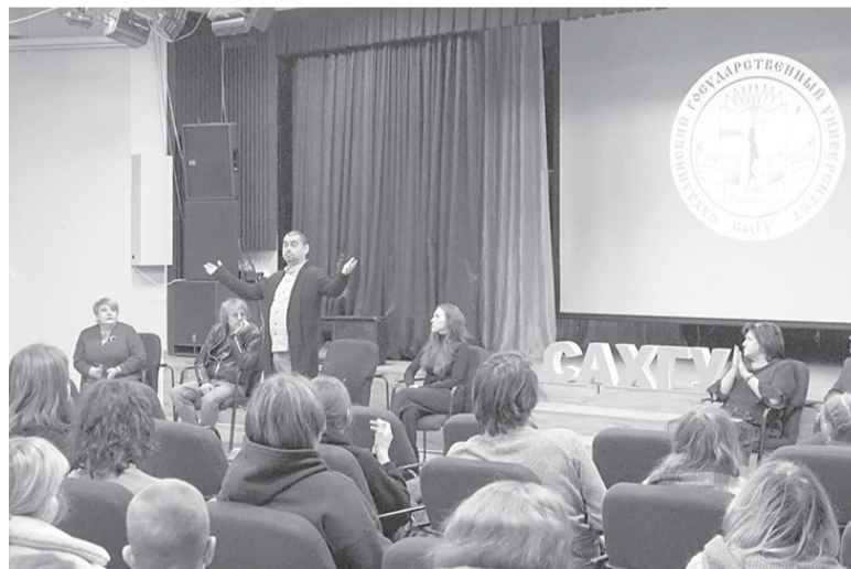
► В ожидании интересного просмотра

В 2023 году на конкурс Росмолодежи поступили заявки по 2293 проектам от 340 вузов России. Победителями стали 687 проектов из 184 вузов. На их осуществление выделено почти 900 млн рублей.