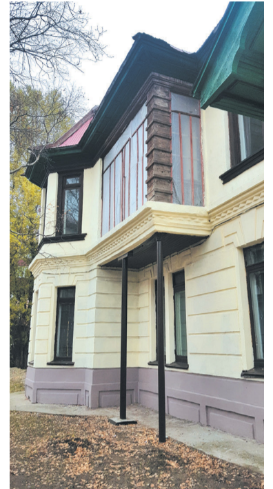
► Аварийный балкон обзавелся надежными подпорками

— Небольшая перепланировка уже проведена. Убрана одна перегородка на первом этаже, в результате образовалось пространство, которое можно использовать в выставочных целях. Кроме того, в соседнем помещении мы установили небольшую экспозицию — часть Владимирки времен каторги. Это те самые экспонаты, что были сде-