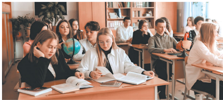
Многие южно-сахалинские старшеклассники обучаются в профильных классах

все пять направлений, и все чаще учащиеся выбирают естественно-научное. Его предпочитают старшеклассники, планирующие поступать в вузы на медицинские специальности. По этому направлению обучают в лицеях № 1 (здесь же открыт Газпром-класс) и 2, гимназии № 3, СОШ № 6.