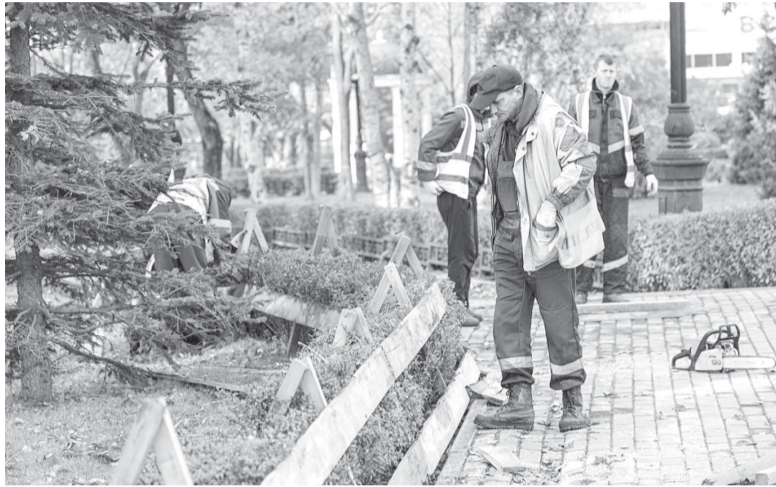
► Зеленые зоны переводят на зимнее содержание

В сахалинской столице завершился самый масштабный за последние годы сезон озеленения