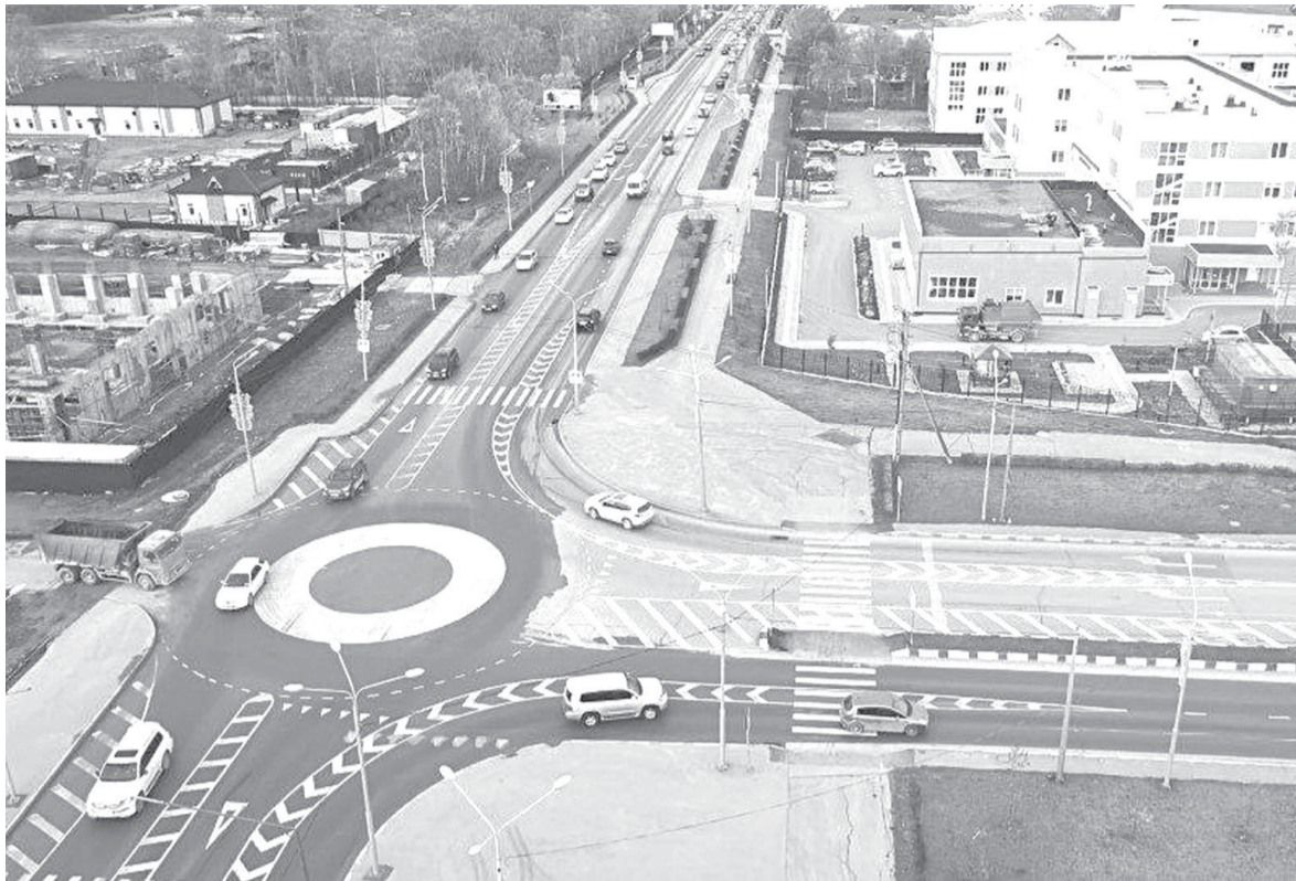
► Круговая развязка на пересечении улиц Комсомольской и Больничной