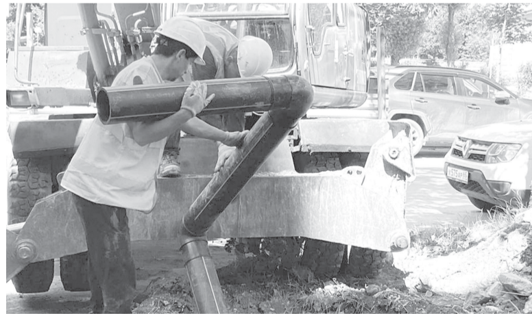
► Полимерные трубы долговечны и надежны

— Начнем с основного. Мы провели летнюю ремонтную кампанию, подготовили объекты водоканала к работе в зимний период. Далее в рамках инвестпрограммы приступили к замене в Южно-Сахалинске 3 тысяч метров ветхих и аварийных трубопроводов. Завершим этот процесс к Новому году. При перекладке коммуникаций используем трубы из современных полимерных материалов, которые не под-