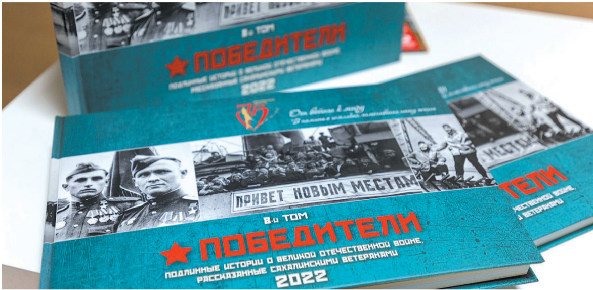
► Восьмой том альманаха «Победители»