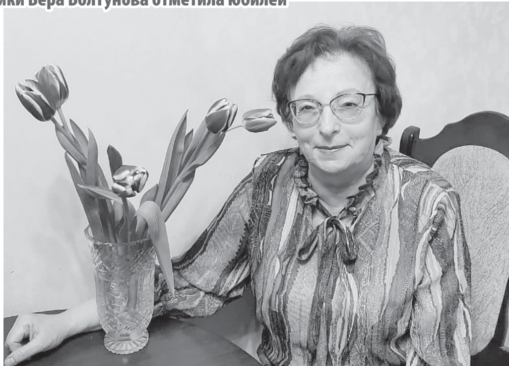
■ НАШ юбиляр

Начиная с 1993 года редакция ежегодно про-