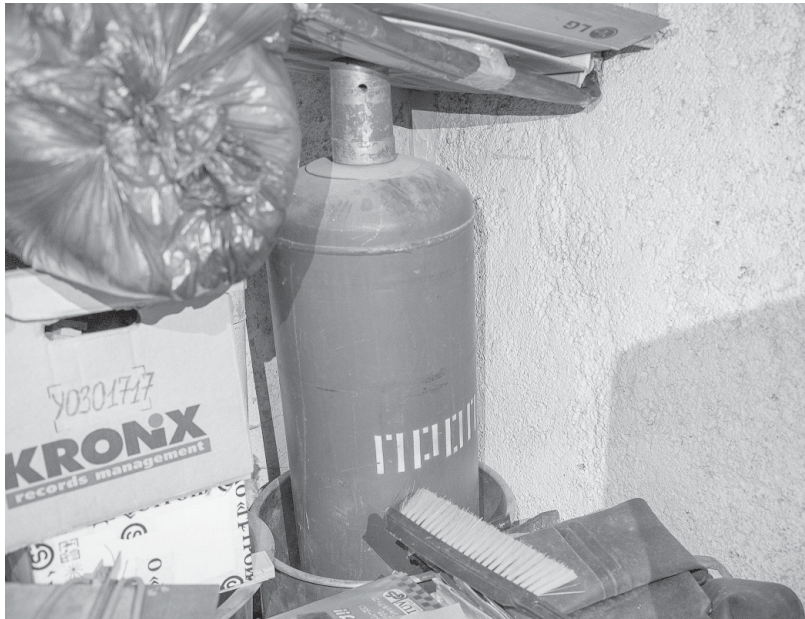
■ ХРАНЕНИЕ ТАКОГО БАЛЛОНА в подвале опасно

Сотрудники отдела муниципального жилищного контроля и департамента городского хозяйства продолжают обследование подвальных помещений МКД. Нередко выявляются нарушения: жильцы оставляют там мусор, мебель, автозапчасти. Были случаи, когда обнаруживались автошины, канистры с бензином, другие горюче-смазочные вещества, лакокрасочные материалы. Такие импровизированные хранилища не только ограничивают специалистам доступ к внутридомовым инженерным коммуникациям, но