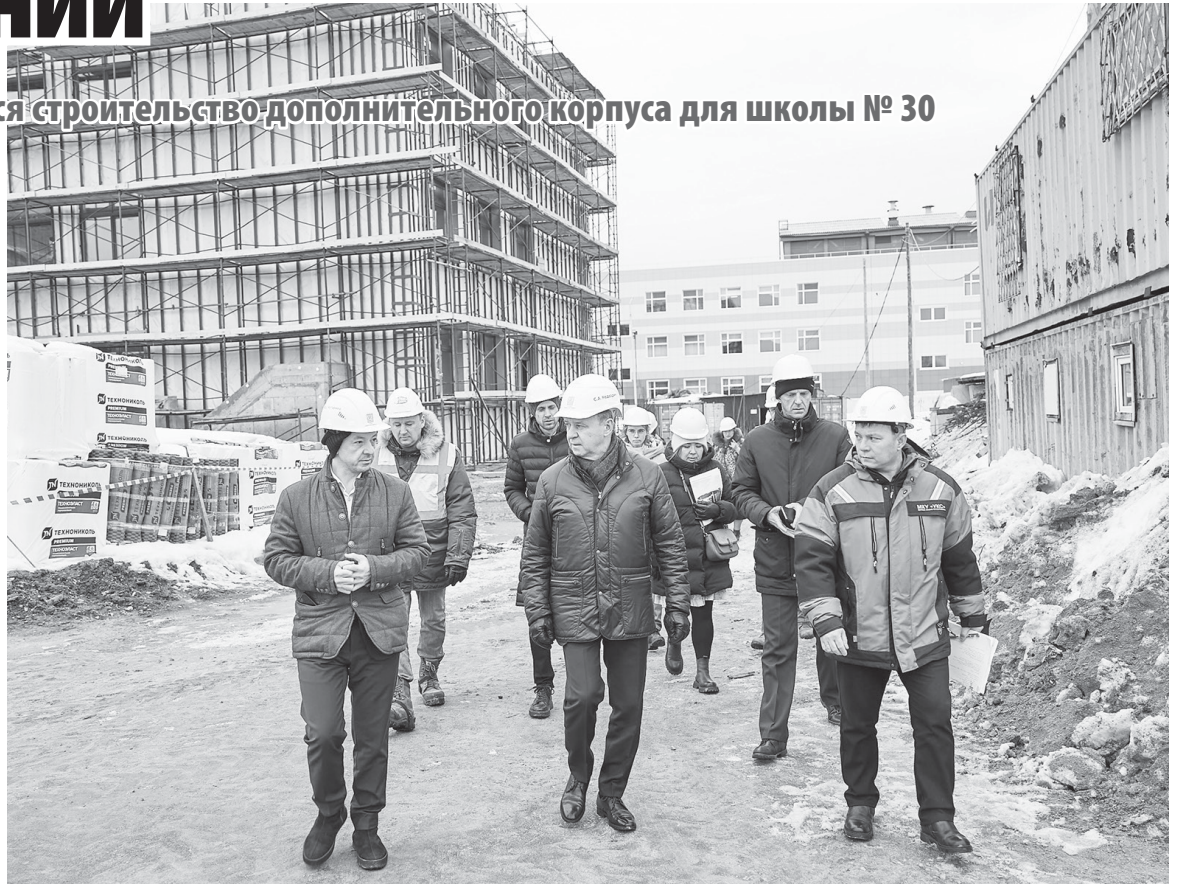
■ СООРУЖЕНИЕ важного объекта - под контролем мэра

В ходе совещания с руководителями структурных подразделений муниципалитета и пред-