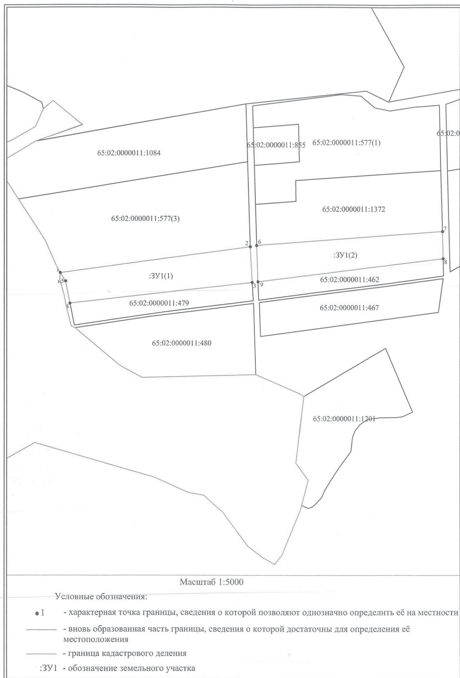
Схема расположения земельного участка или земельных участков на кадастровом плане территории