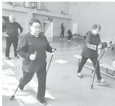
► Для пожилых южносахалинцев организуют активный досуг

вышли на маршруты 100 новых автобусов на газомоторном топливе, произведенных в Республике Беларусь. Кроме того, при поддержке правительства региона закуплено еще 25 машин