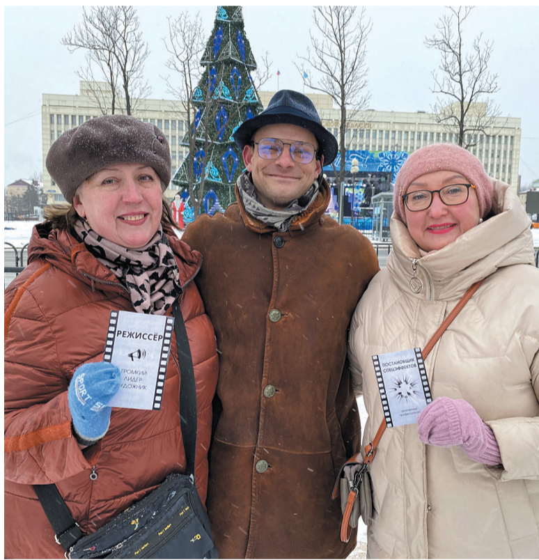
► Роли распределены

Потом выдвигаемся к киноконцертному залу «Октябрь». Дмитрий рассказывает, что первый фильм на его экране показали в 1967 году, и это была «Свадьба в Малиновке». Одна из участниц экскурсии тут же добавляет: «А первый детский фильм — «Золотой ключик». В фойе мы увидели металлическую фигуру оператора, служившую декорацией в кинотеатре «Комсомолец». Когда его здание передали под малую сцену Чехов-центра, оператор переехал в «Октябрь». А руководство КТЦ объявило конкурс на лучшую историю рождения этого персонажа. Любопытный может отправить свой вариант на электронную почту учрежде-