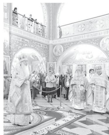
► Божественная литургия — центральное событие юбилейных торжеств

— Самой важной вехой 2023-го в духовной жизни нашего города и всего региона в целом считаю празднование 30-летия Южно-Сахалинской и Курильской епархии. В течение года в городах и селах Сахалина и Курил проходили различные события, посвященные юбилею, а главным в этой череде стало архиерейское богослужение. Для участия в нем в Южно-Сахалинск съехались архиереи, в разные годы управлявшие островной епар-