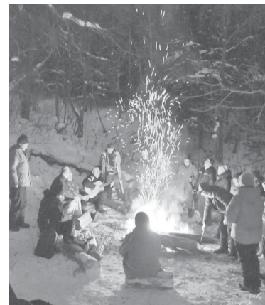
Встреча Нового года у костра