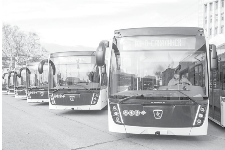
► Автобусный парк Южно-Сахалинска пополнил комфортный и экологичный транспорт

Поздравляю всех южносахалинцев с наступающим Новым годом. Коллегам желаю хороших новостей, а горожанам — здоровья и благополучия!