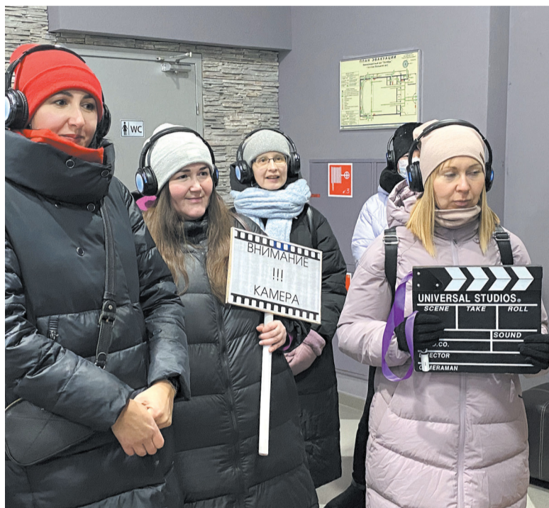
► Съёмочная группа