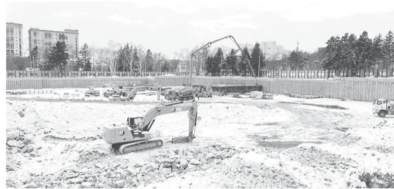
► В научно-образовательном комплексе «СахалинТех» начался новый этап строительства учебных и научных корпусов

Самый вдохновляющий для меня момент 2023 года — мас-