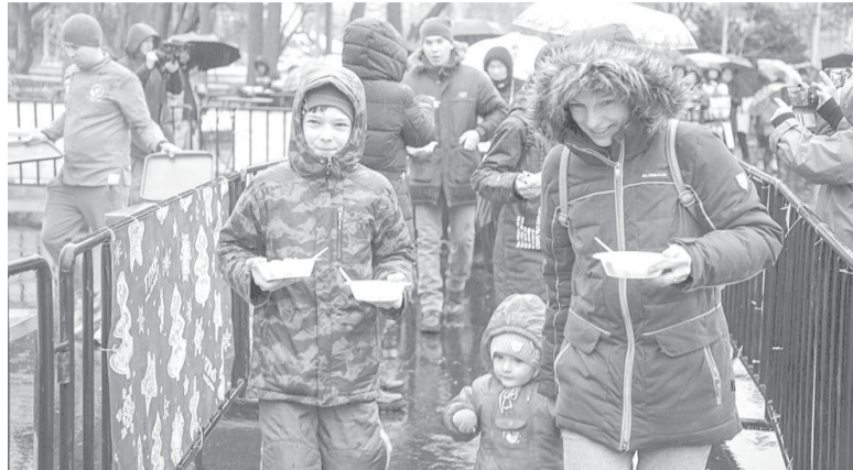
Для посетителей фестиваля приготовили 100 килограммов пельменей

— Я с удовольствием хожу на подобные мероприятия! «День пельменя» — уютный домашний праздник. Ведь не зря одной из объединяющих традиций у многих семей стала