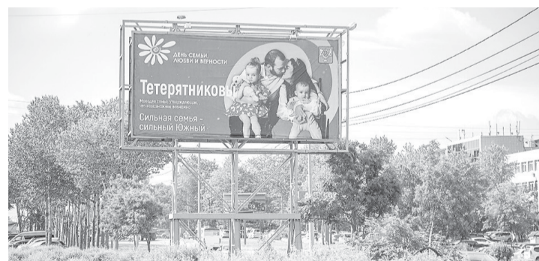
► Участниками фотопроекта «Семьи Южного» стали пять семейных пар

Поздравляю всех с наступающим Новым годом! Желаю, чтобы семьи были крепкими, а миром правила любовь!