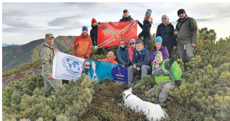
► Высота взята!

Как сказал на презентации сам автор, издание предназначено для самостоятельных путешественников, любителей природных красот,