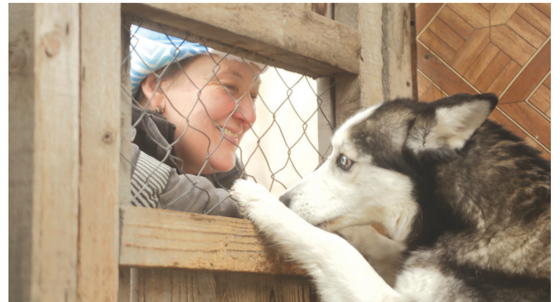
► Друг человека ждет добра

вать так называемых кураторских собак и кошек.