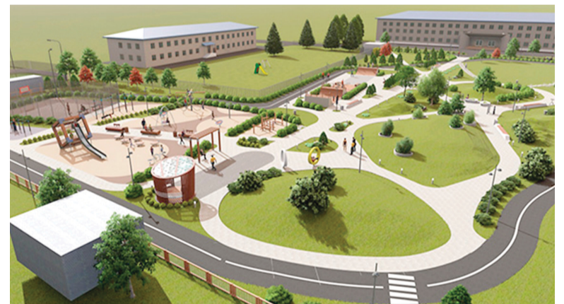
► Сквер Молодежный