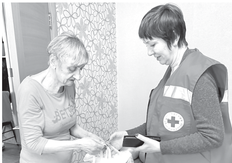
► Волонтеры сахалинского отделения Российского Красного Креста берут под опеку пожилых людей

— У сахалинцев пользуются спросом курсы по оказанию первой помощи пострадавшим и мастер-классы по уходу за пожилыми людьми и инвалидами на дому, что предусмотрено в федеральных программах РКК. Бесплатные занятия по подготовке инструкторов, оказывающих первую помощь, ведут приглашенные тренеры, их направляет сюда центральное отделение нашей организации. В реестр инструкторов РКК по первой помощи после окончания курсов занесено 15 человек. Занятия организуем совместно с партнером — сахалинской патронажной службой «Родные люди», в здании на ул. Ленина оборудован учебный кабинет. Спустя год после создания наше отделение работает уже по