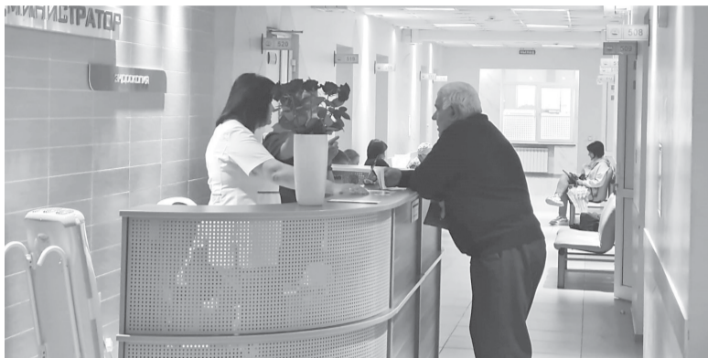
► В Центральной поликлинике Южно-Сахалинска

Проект «Забота. Защита. Уважение» пользуется огромной популярностью у пенсионеров Сахалинской области