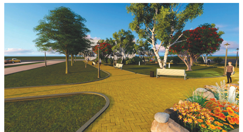
► Сквер Геологов