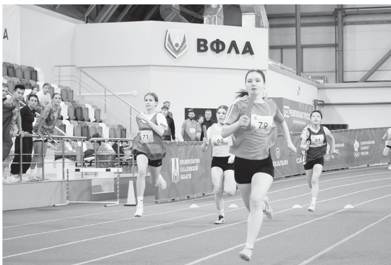
■ ВПЕРЕД, к победе!

Общая длина дистанции для команды в этом году составила 800 метров - по 200 метров на каждого участника. Победите-