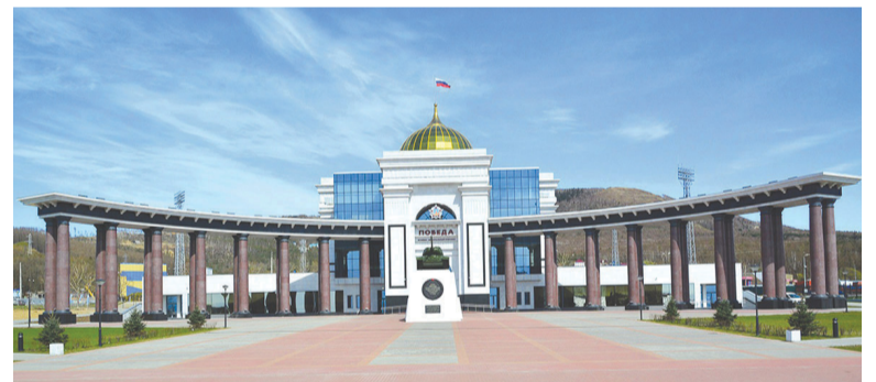
► Музейно-мемориальный комплекс «Победа»