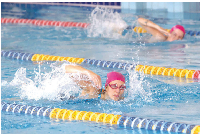
► Кипит борьба