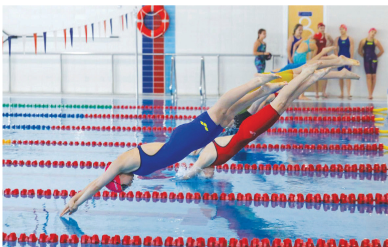
► Удачный старт решает многое