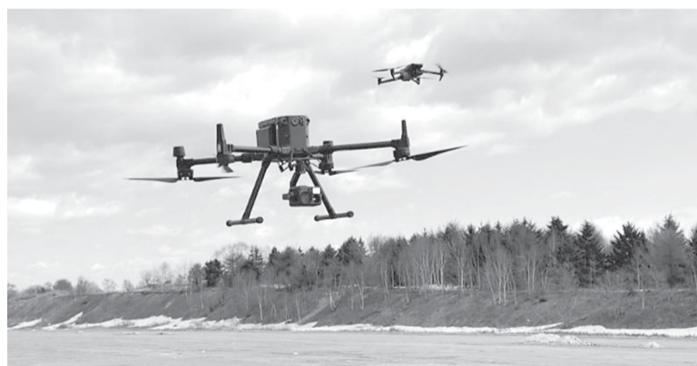
► БПЛА на взлете

— Сейчас самое время начинать поиск несанкционированных свалок, наблюдать за лесами, чтобы выявлять возгорания. Также мы отработываем сценарий по поиску зарослей борщевика Соновского. Использование дронов в наше время очень актуально. Беспилотник, способный быстро взлететь и обследовать территорию с воздуха, без использования вертолетов или другой дорогостоящей техники позволяет экономить бюджетные средства, эффективнее выполнять работу, — отметил