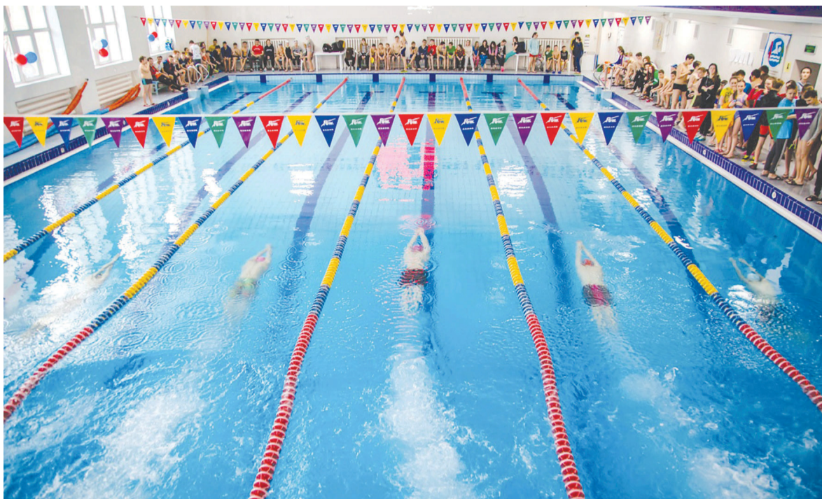
► Соревнования — проверка мастерства