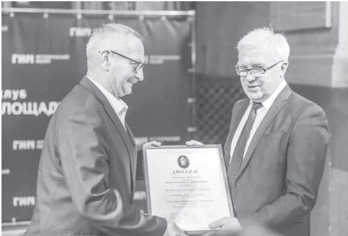
▶ Во всех отношениях исторический момент