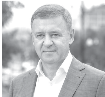
► Мэр Южно-Сахалинска Сергей Надсадин

Что касается ветхого и аварийного жилья, Сахалинская область стала одним из первых в стране регионов, полностью расселивших аварийный жилфонд, признанный таковым до 1 января 2012 года. В период с 2013 по 2017-й в Южно-Сахалинске в новые дома переехали почти 5,6 тысячи горожан. Далее мы досрочно завершили программу по переселению граждан из аварийного жилищного фонда, признанного таковым до 1 января 2017 года, в ее рамках к 2020-му ключи от новых квартир получили почти 1000 человек. Одновременно начали переселять