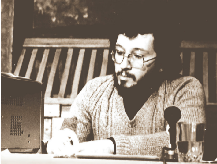
► Случалось быть и спортивным комментатором

Родители хотели, чтобы сын пошел учиться на врача, но медицина его совсем не привлекала. Не лежала душа и к техническим специальностям, поэтому выбор пал на журналистику. Правда, в военном городке газеты не было, поэтому в Свердловск он отправился без творческих работ, но вручил статус золотого меда-