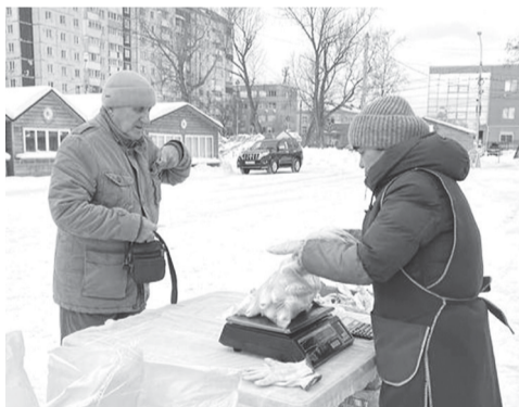
► Благодаря региональным проектам сахалинцев круглый год снабжают рыбой