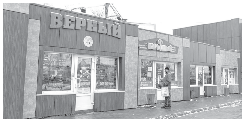
► Вид этих павильонов уже преобразился

Прежде всего сотрудники департамента провели анализ и фотофиксацию строений по главным магистралям центральной части города в границах улиц Сахалинской, Ленина, Пуркаева и Горького. Чтобы выяснить, насколько расположенные на них