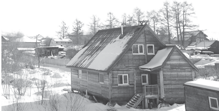
► Каждый может выбрать свой вариант дома