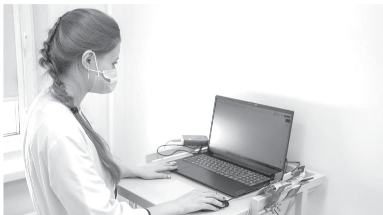
► Компьютер — надежный помощник в проведении диспансеризации

ПАЦИЕНТАМ, страдающим хроническими заболеваниями, можно записаться на диспансерное наблюдение по номеру 1-300 или у своего лечащего врача.