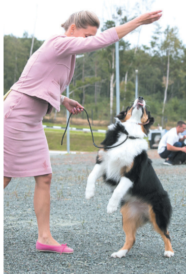
► Дрессура — язык жестов