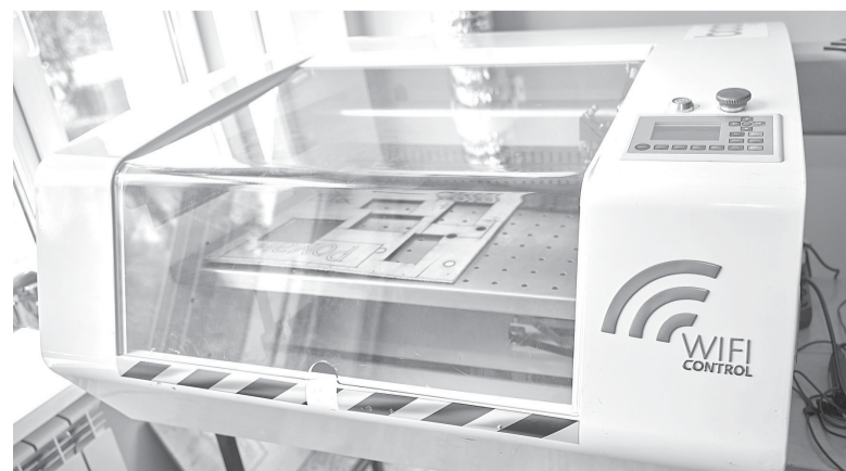
► Лазерный станок