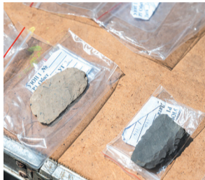
► Древние предметы, найденные в районе строительства жилого комплекса «Уюн»

сяч лет назад Сусунайская долина, где сегодня располагается островная столица, представляла собой лесотундру. По ней вдоль реки Сусуи мигрировали стада мамонтов, оленей, бизонов, овцебыков и других крупных животных. За