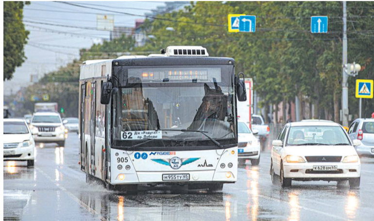
► Одна из задач транспортной реформы — сделать автобусное сообщение доступным для жителей всех микрорайонов

— В День знаний данная система прошла проверку — не было зафиксировано ни одного сбоя при использовании школьных проездных, хотя прежде в начале сентября такое случалось, —