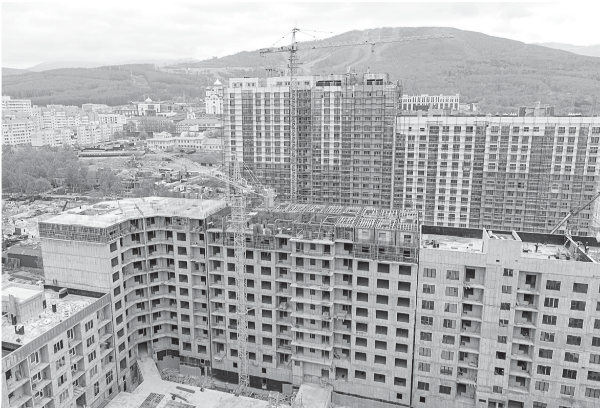
► Согласно Генплану крупномасштабное жилищное строительство — один из приоритетов развития Южно-Сахалинска