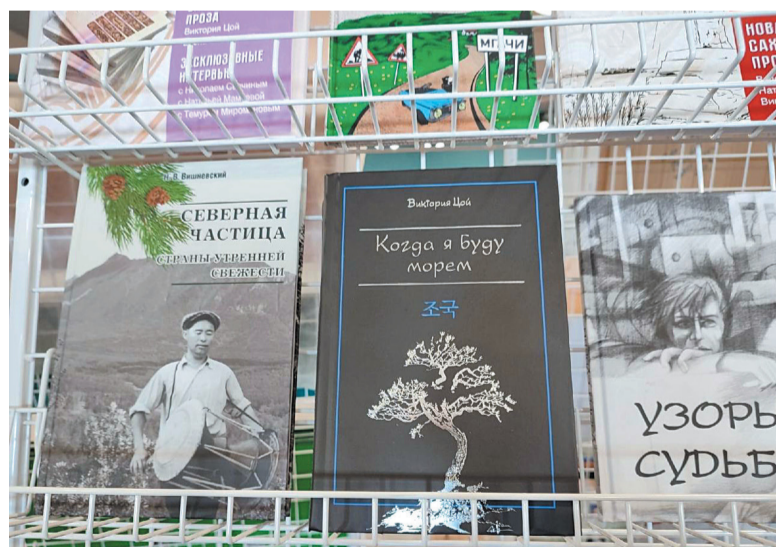
► Подборка книг, изданных островной библиотекой