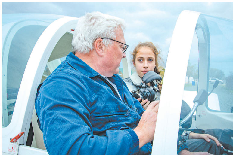
► За штурвалом инструктор и ученица