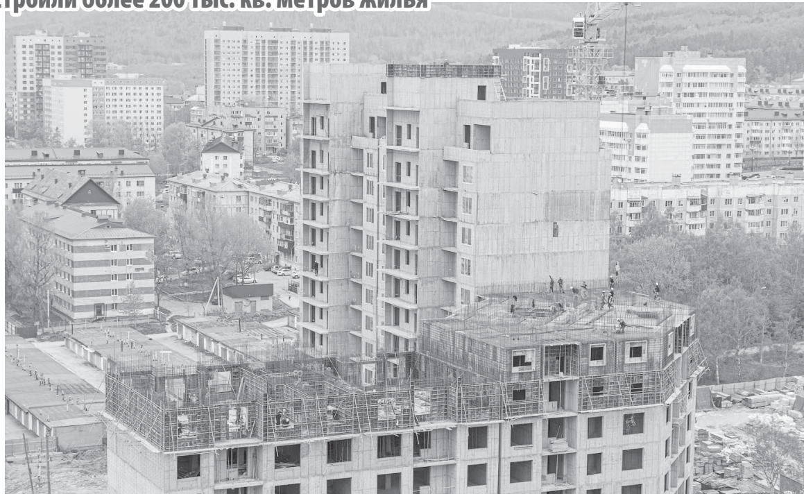
■ БЫСТРО строится наш Южный!

Новые дома отличают современный подход к инженерным решениям, функциональная планировка, благоустройство и озеленение прилегающей территории, транспортная доступность. Строительство микрорайонов предполагает их обеспечение важной социальной инфраструктурой - детскими садами и школами. Общее количество мест в новых образовательных учреждениях превысит 10 тысяч. Кроме того, запланировано размещение двух поликлиник, которые призваны охватить медицинскую по-