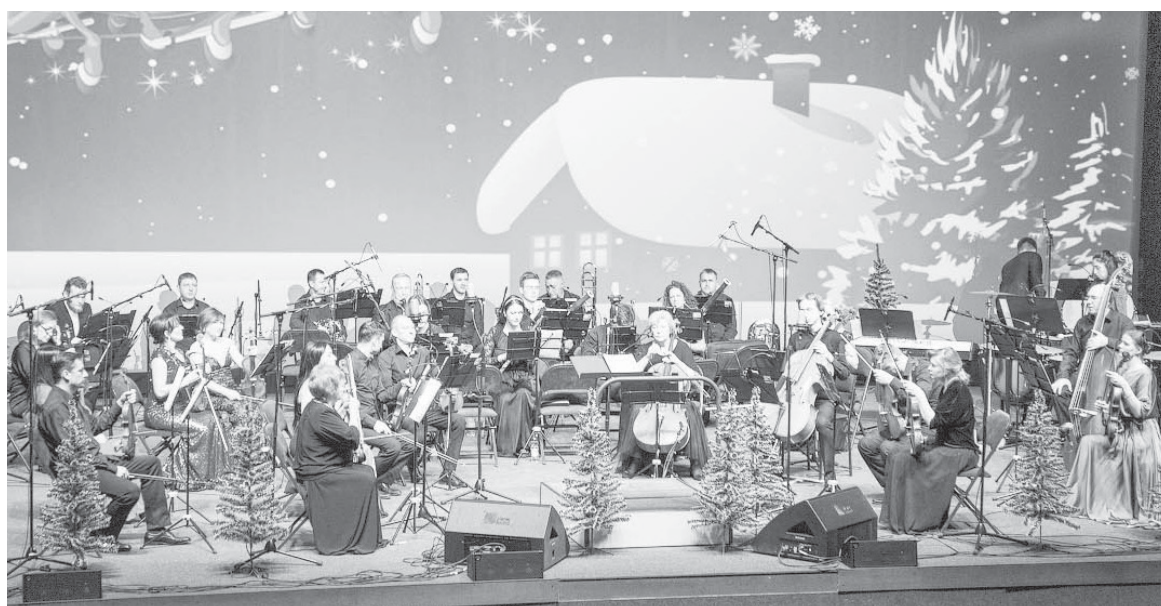
■ НА СЦЕНЕ творится настоящее волшебство!

Дети ждут сказки, счастья и волшебства. Наши ребята очень просились на «Щелкунчик». Большая удача, что удалось выбраться на концерт такой дружной компанией: пять взрослых и