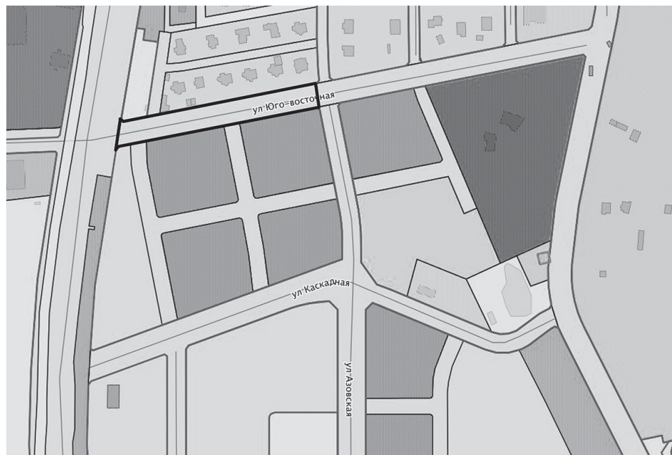
- границы проектируемой территории