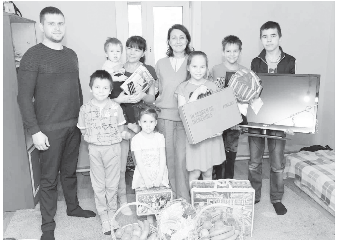
■ РАДОСТЬ ПРИШЛА И В ЭТУ СЕМЬЮ