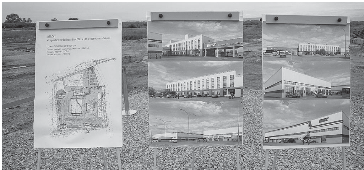
■ ЭТИМ ПЛАНАМ суждено осуществиться уже в скором времени

- Через два года на этом месте вырастет новая производственная база, работа которой обеспечит жителям Южно-Сахалинска совершенно иные транспортные возможности. Ее строительство позитивно отразится на экологической ситуации в городском округе. В ближайшее время к нам поступят современные автобусы и электробусы. Кроме этого мы меняем систему работы с перевозчиками, строим транспортно-пересадочные узлы. Общественный транспорт должен быть доступным и комфортным, по-