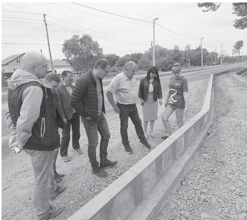
■ ОБЩЕСТВЕННИКИ тщательно контролируют качество дорожных работ

В нынешнем году особое внимание было уделено обследованию отклонения высотных отметок смотровых и дождеприемных колодцев, выявлено 280 дефектных единиц, на 239 недостатки устранены, работы продолжают. Также выполнена регулировка высотного положения люков с использованием плит ПД6 на улицах Есенина, Горького, Больничной, проспекте Победы. В городе ведутся ремонт и замена