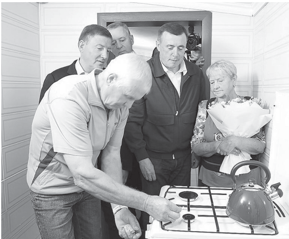
■ ГАЗ ПРИШЕЛ!

- Опыт Сахалинской области достоин применения в других регионах России. В остальных субъектах Федерации или компенсируют половину расходов на догазификацию, или оказывают поддержку только некоторым категориям граждан. В Сахалинской области амбициозные планы по догазификации и поэтапная про-