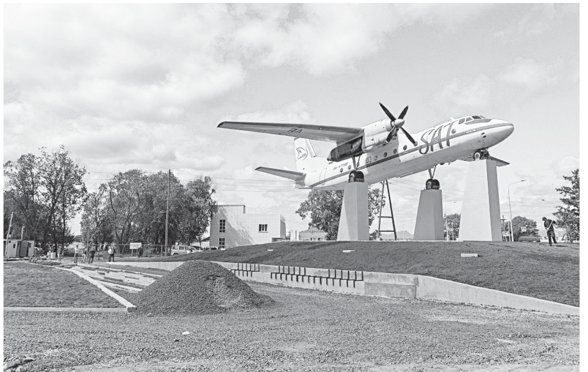
■ ПАМЯТЬ о небе и его тружениках

Работы выполняются ритмично, подрядная организация придерживается графика. Вме-