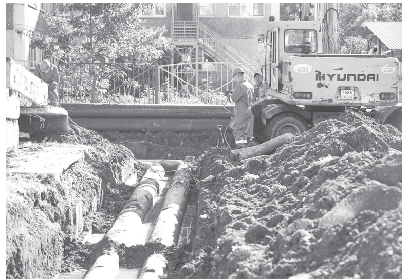
► Летом в городе шла масштабная реконструкция теплосетей

На 9,5% вырос объем реализации платных услуг.