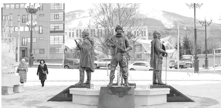
► В новом сквере Защитников Отечества установлена композиция «Воины четырех эпох»