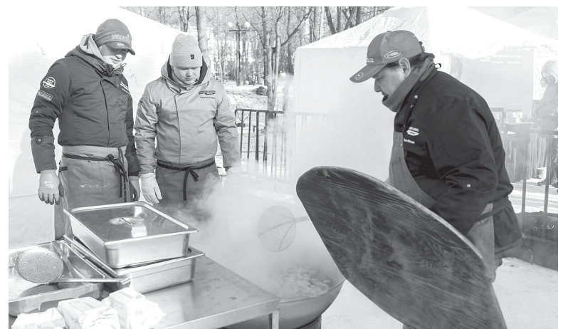
► Для гостей фестиваля с любовью приготовили вкусные ароматные пельмени

А 14 декабря на завершении фестиваля гостей ждали выступления местных творческих коллективов, мастер-классы и две ярмарки. Первая – от мастеров-ремесленников, на которой можно было купить все, что душе угодно: от вязаных носков и кукол до стильных украшений. На второй сахалинские товаропроизводители радовали морепродуктами, разными сортами рыбы, меда и чая, сладостями и мясными деликатесами.