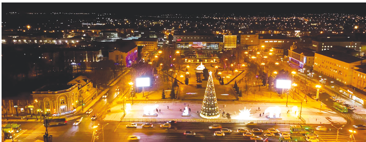
► Декоративная подсветка и современные арт-объекты на центральных улицах города создают новогоднее настроение

Культурно-туристический центр приглашает пройтись по «Городу-галерее», проникнуть в «Тайны штаба охранных войск» и услышать «Забытые истории знакомой улицы»