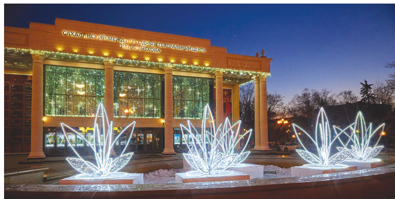
► Автобусная экскурсия «Огни ночного города» начинается от Чехов-центра

► 7 января – праздник с выступлениями творческих коллективов города и мастер-классом «Рождественский подарок». Начало в 13.00.