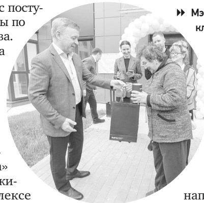
► Мэр города вручил ключи от новых квартир новоселам

За 9 месяцев 2024 года введено 109,8 тыс. кв. м жилья, что на 7,2% больше, чем за 9 месяцев 2023 года.