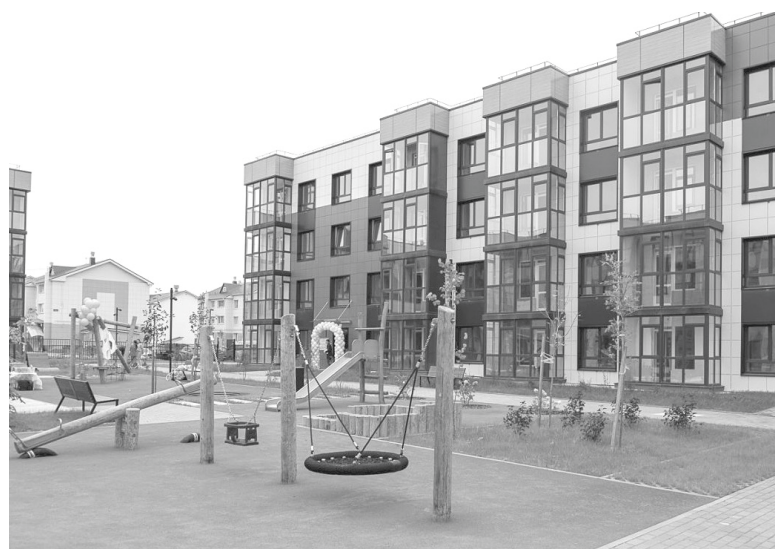
► Переселенцам из ветхого и аварийного жилья предоставляют квартиры в ЖК «Большая полянка», построенном в Дальнем

– Одновременно со строительством новых микрорайонов появляются детские сады и школы. Хватает их сегодня?