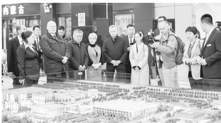
► Для российской делегации провели экскурсию в крупнейший логистический центр Пекина