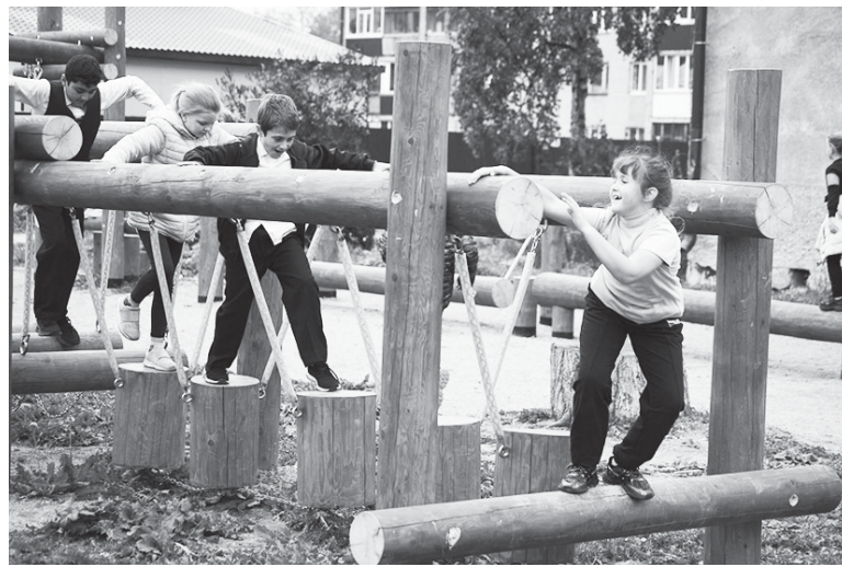
Ребята с удовольствием осваивают полосу препятствий.