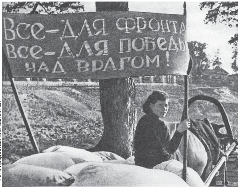
Вся страна жила и работала ради одного – ради Победы.