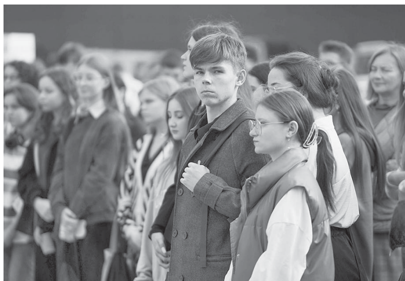
■ ИХ ЖДУТ ОТКРЫТИЯ

в области биологии, подготовить проекты в сфере искусственного интеллекта или провести эксперименты. Наш университет предоставил им шанс попробовать себя в этих направлениях, и в итоге каждый будет реализовывать свои задумки и представлять результаты своей работы, - подчеркнул ректор Сахалинского государственного универ-