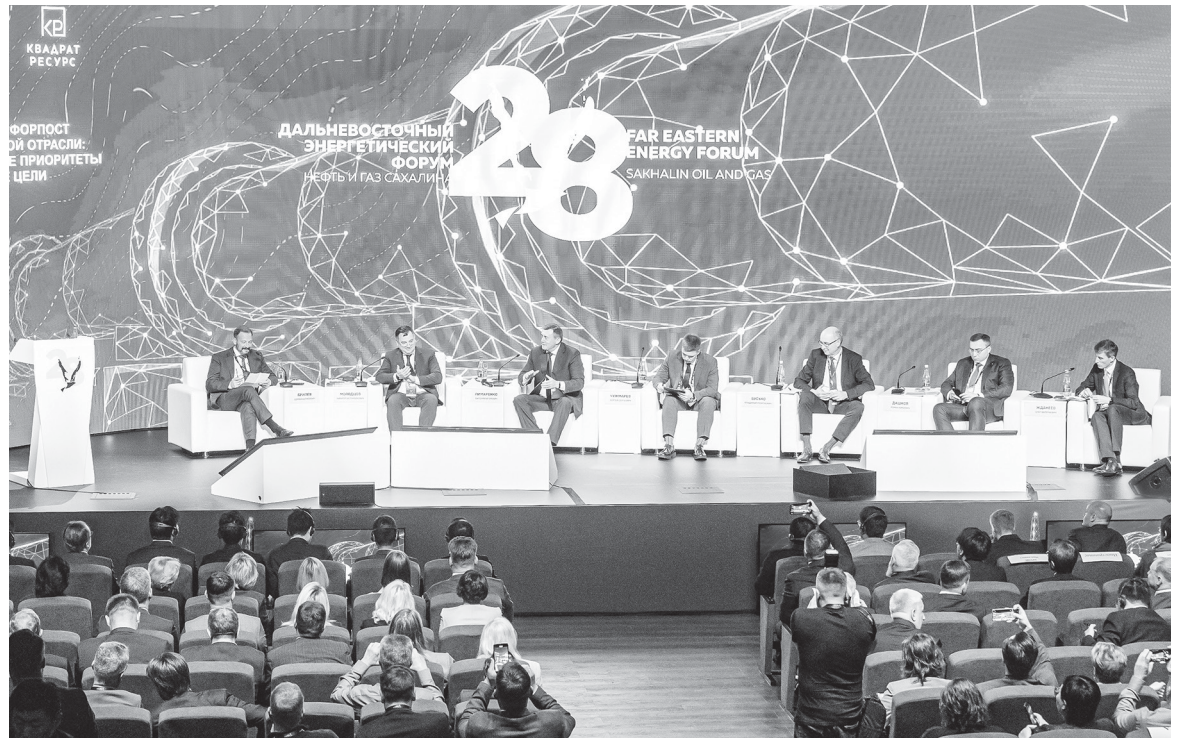
■ НА 28-м ДАЛЬНЕВОСТОЧНОМ ЭНЕРГЕТИЧЕСКОМ ФОРУМЕ "Нефть и газ Сахалина"

- Наша стратегическая задача - обеспечить максимальную локализацию нефтесервисных услуг шельфовых проектов на острове. Три года назад совместно с компанией "Сахалинская Энергия" мы дали старт строительству нефтегазового