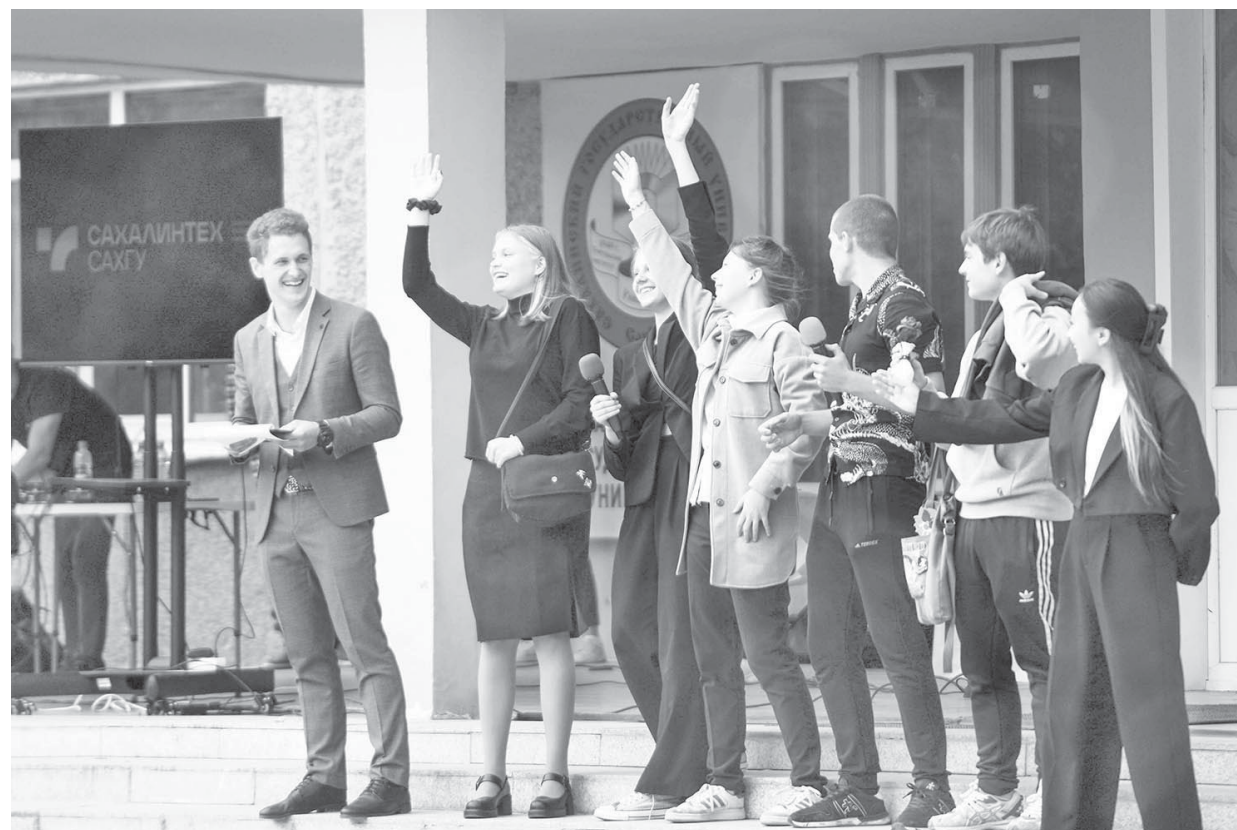
■ ПУТЬ в науку начинается

Теоретическую базу они получат дистанционно, а для решения практических задач и работы в лабораториях будут приезжать в университет на краткосрочные интенсивы. Уже в феврале наиболее мотивированные участники проекта соберутся на смене по направлению "Наука" в центре для одаренных детей "СахалинТех.Алаид", где вместе с ин-