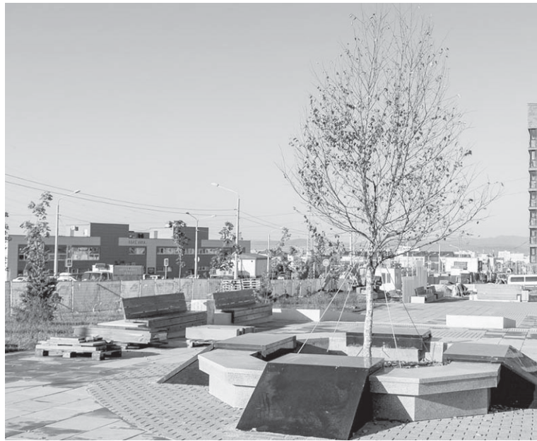
■ ОЗЕЛЕНЕНИЕ - обязательное условие строительства нового объекта