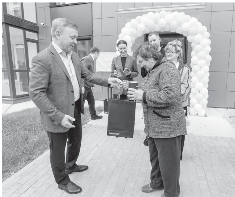
■ СЧАСТЛИВЫЙ МОМЕНТ

В перспективе в этом районе Дальнего планируется устройство спортивно-игровых площадок, пешеходных и велосипедных дорожек, общественных пространств, строитель-