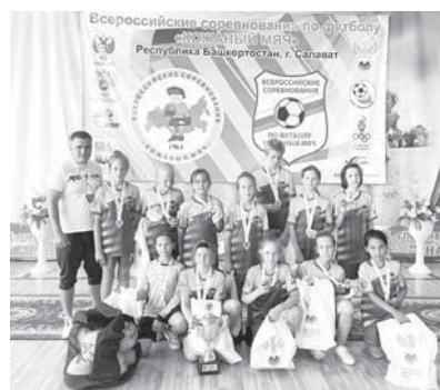
► Женская футбольная команда школы № 11 «Сахалиночка» – неоднократный призер различных турниров

– Многие наши выпускники сейчас на фронте, об их подвигах мы регулярно рассказываем на занятиях. Некоторые имеют государственные награды. К великому нашему сожалению, часть их получена уже посмертно. Об этих трагедиях больно говорить, но и молчать нельзя. Особенно в условиях информационного шума, который сейчас царит на просторах Интернета и в СМИ. Дети ведь не рождаются патриотами, а становятся, поэтому им нужен благородный пример самоотверженных людей! – уверен директор.