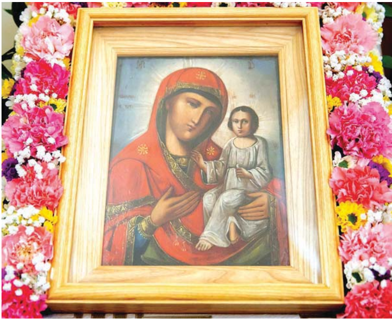
► Преображенная реликвия