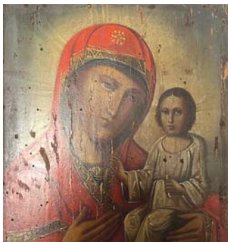
► Икона до обновления