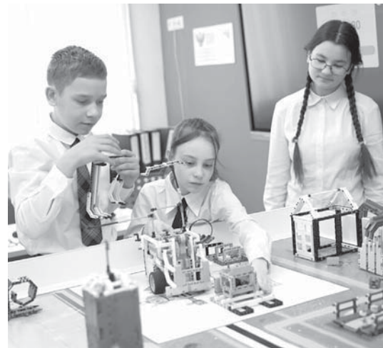
► В Южно-Сахалинске активно внедряют программы технической направленности и робототехники в систему дополнительного и основного образования

О сегодняшнем дне сферы образования Южно-Сахалинска