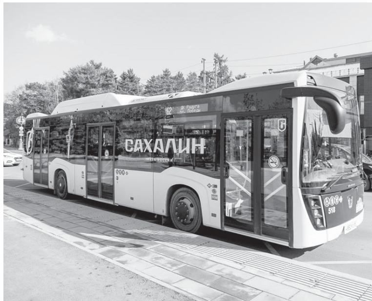
■ САДЯСЬ В АВТОБУС, не забудьте учесть тарифные перемены

По всем вопросам необходимо обращаться в пассажирскую компанию "Сахалин" (телефон 71-29-94), в диспетчерскую