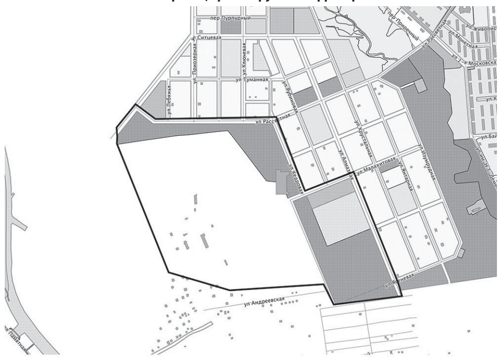
границы проектируемой территории

Приложение № 1 к постановлению администрации города Южно-Сахалинска от 23.10.2024 № 3522-па Схема границ проектируемой территории