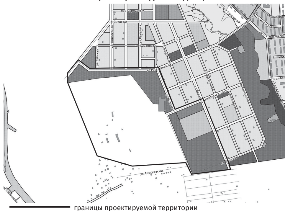
границы проектируемой территории