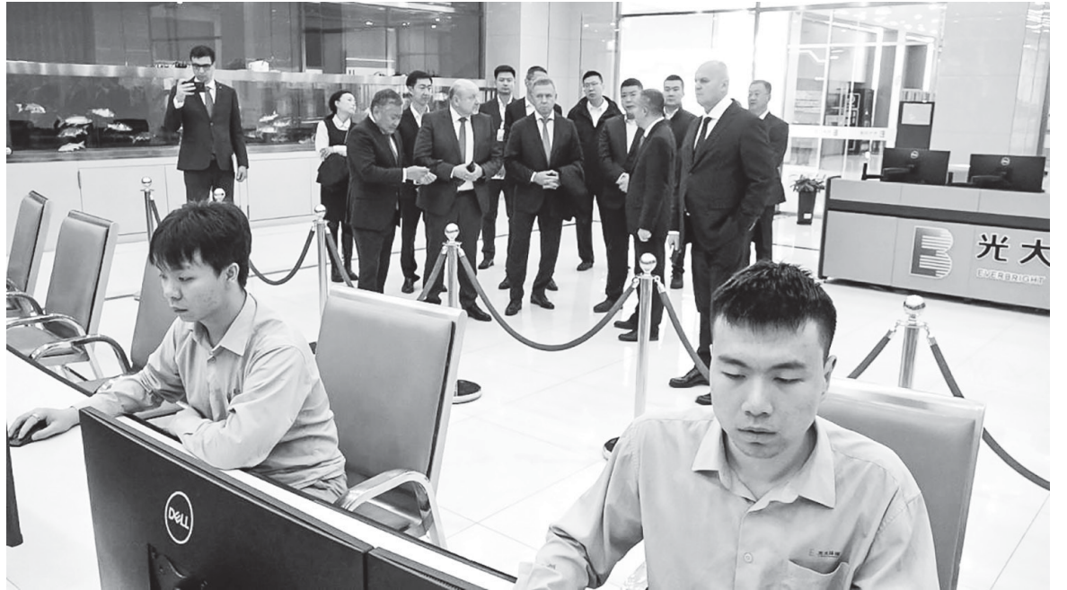
■ ПОСЕЩЕНИЕ современного завода по переработке отходов в Харбине

- Безусловно, произвели впечатление масштабы завода, отлаженность технологических процессов, ухоженность тер-