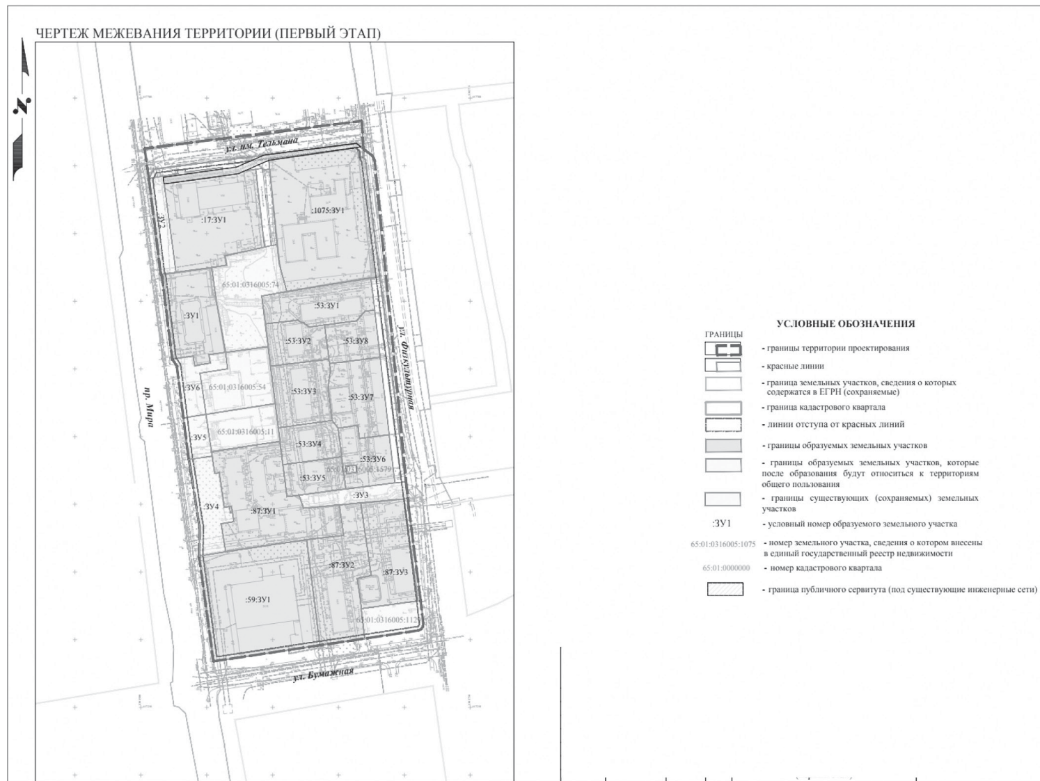
Приложение № 3 Утвержден постановлением администрации города Южно-Сахалинска от 21.12.2023 № 3906-па