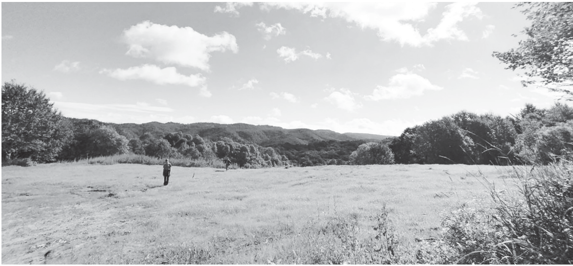
► Раньше здесь была огромная мусорная свалка