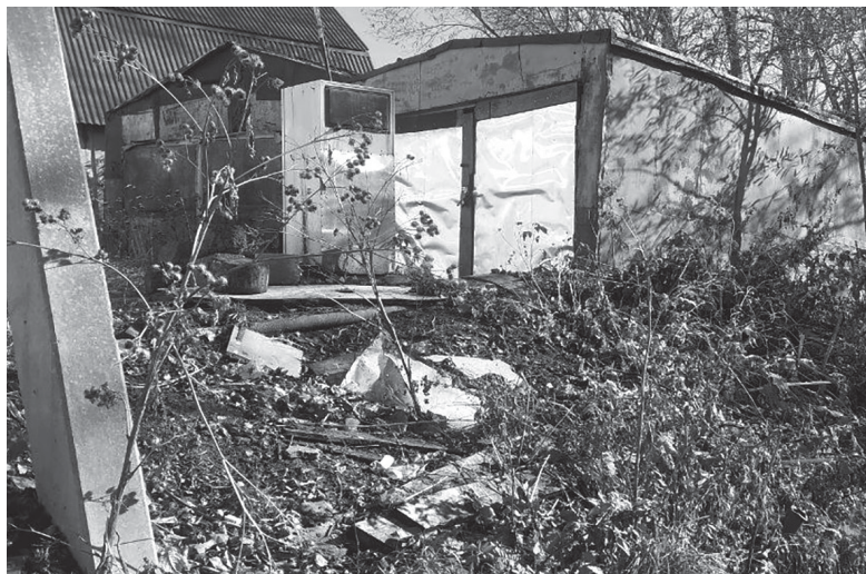
► Удручающее зрелище...

Пусть не обижаются на меня синегорцы, но в качестве примера я приведу именно это село. Причина понятна: я живу в Синегор-