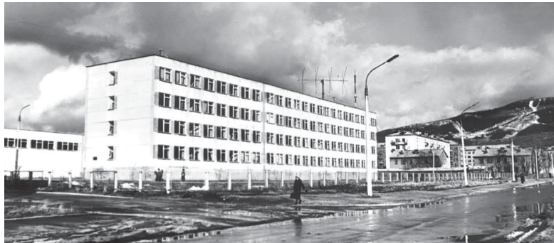
► Средняя школа № 3, г. Южно-Сахалинск. Построена в годы 10-й пятилетки. 1980 год