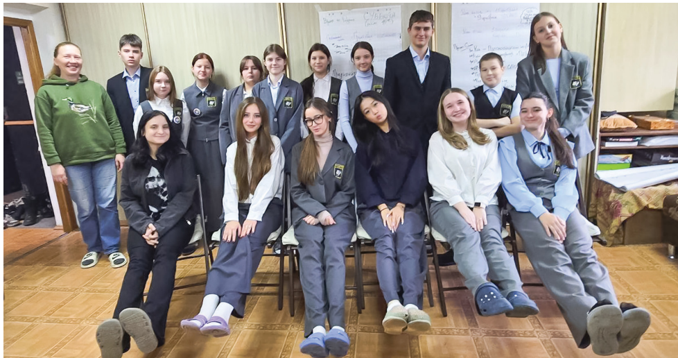
► В ноябре волонтеры встретились с представителями экоцентра «Родник», чтобы познакомиться с работой и проектами объединения