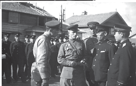
► Советские офицеры опрашивают начальника уездного полицейского управления города Синуна (сейчас – Поронайск), август 1945 г.

Жизнь и творчество Григория Соколова на протяжении более 30 лет были связаны с островным краем. По воспоминаниям военко-