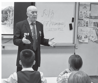
► Урок мужества в южно-сахалинской школе № 3