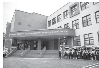
► В 2025 году в ЖК «Авангард» открыли самую крупную школу в Сахалинской области на 1260 мест