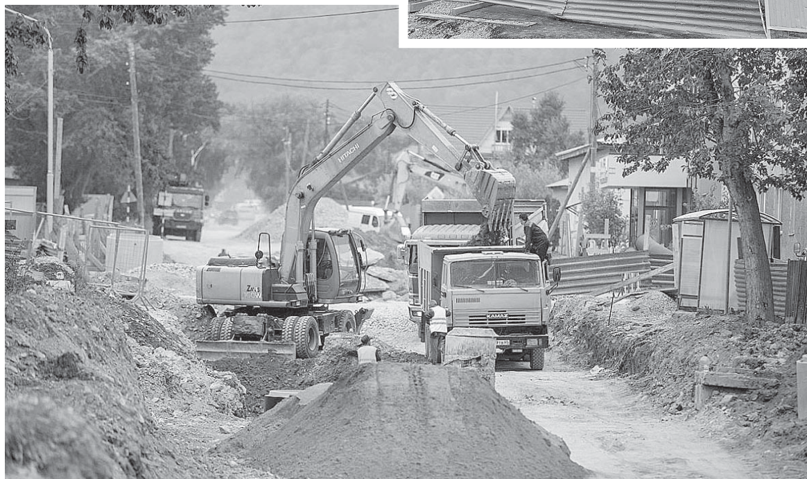
■ РЕМОНТ идет по графику

полнении планируется к октябрю текущего года, затем ее заасфальтируют.