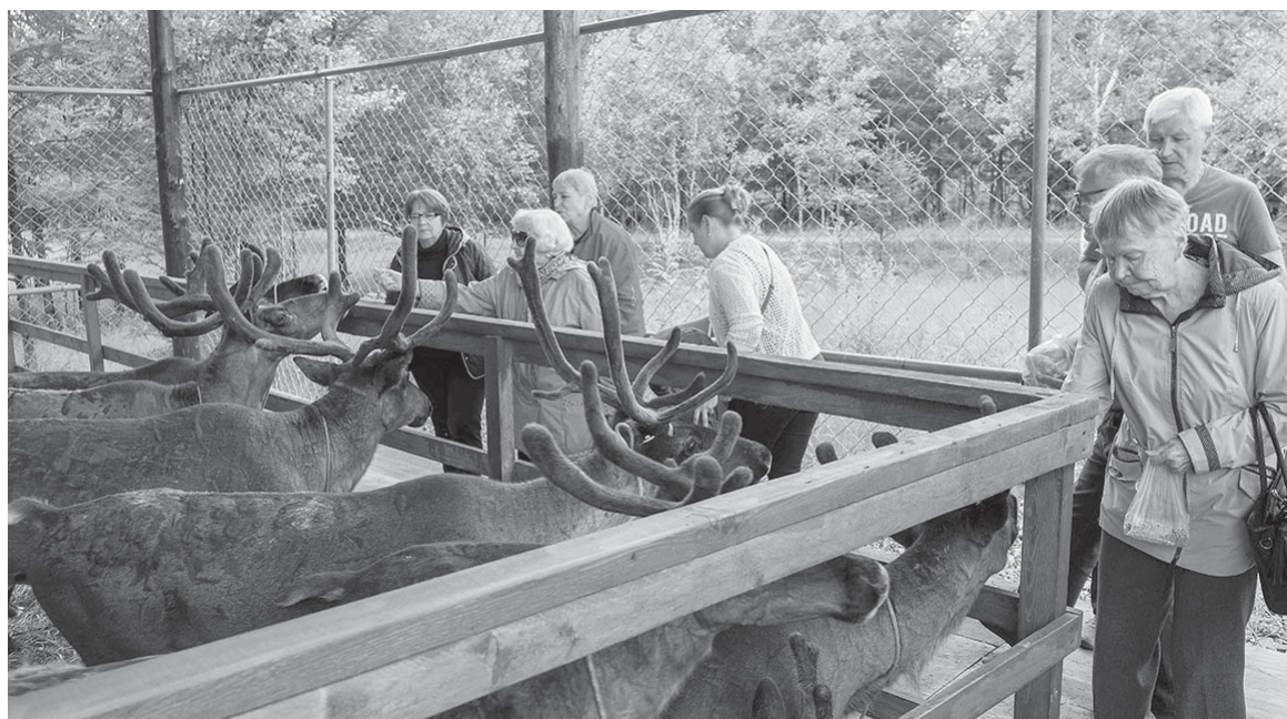
■ ПРИЯТНОЕ ЗНАКОМСТВО!

Автобус для поездки предоставил департамент внутренней политики администрации Южно-Сахалинска. Руководство эко-