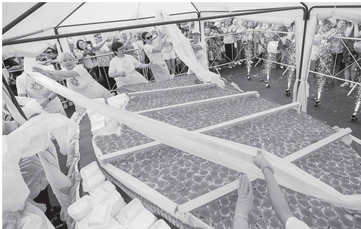
■ ОГРОМНЫЙ БУТЕРБРОД С КРАСНОЙ ИКРОЙ - традиционное угощение фестиваля «Остров-рыба»

За понравившиеся кулинарные изыски можно будет отдать свой голос в Интернете.