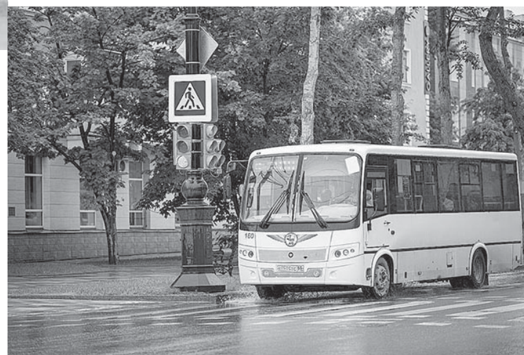
■ ГОРОДСКОЙ ТРАНСПОРТ будет работать по-новому