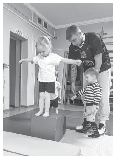
К спорту надо приучать с самых ранних лет!