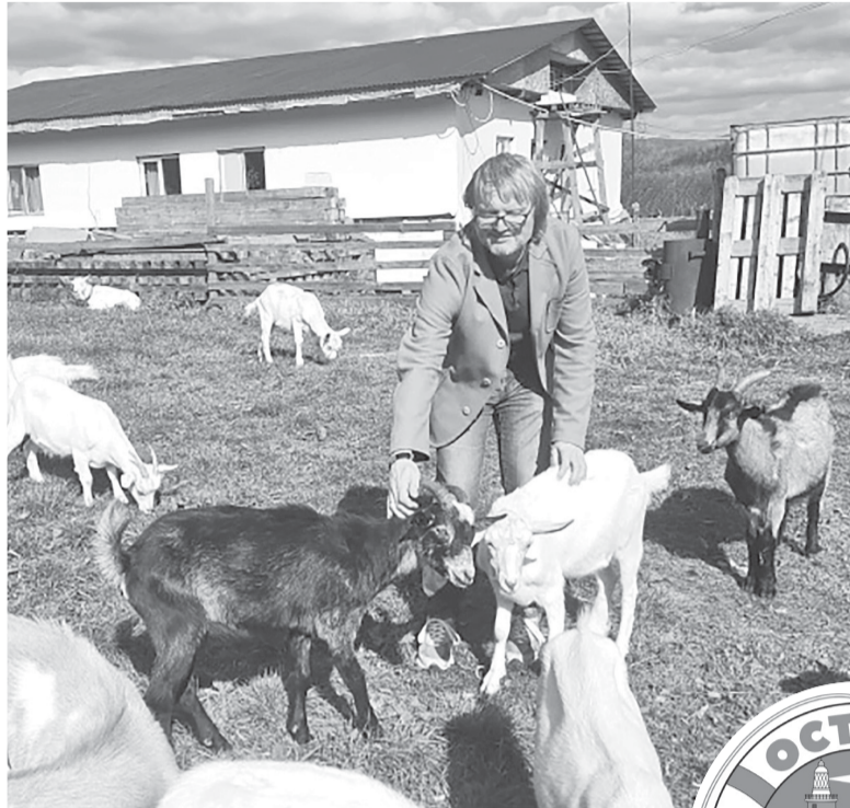
Уход за животными тоже метод избавления от зависимости