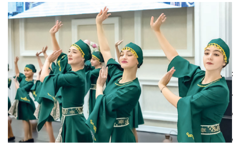
▶ Праздник украсили выступления национальных коллективов