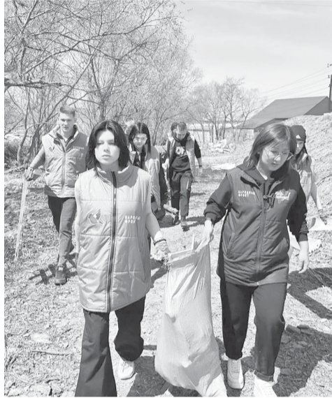
► На субботнике по уборке реки Рогатки совместно с представителями департамента городского хозяйства, советов домов, молодежи Народного фронта, волонтерами

– Совершенно верно! Я родилась в Корсакове. К сожалению, очень рано потеряла маму, и нас с братьями воспитывал отец.