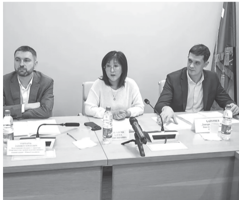
► Заседание Общественного совета Южно-Сахалинска