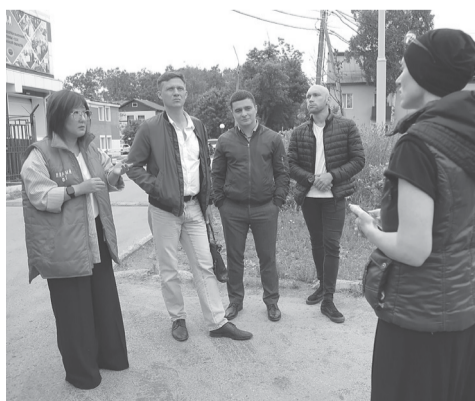
► На встрече с жителями дома № 242 на улице Ленина обсуждались вопросы содержания двора