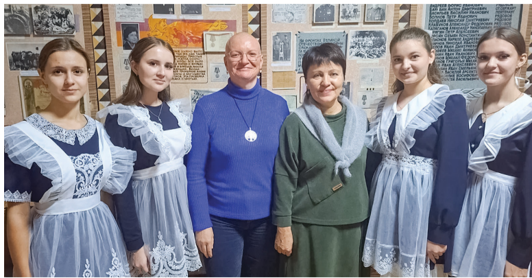
► В школьном музее боевой славы, село Новоанновка

– По приезде в Краснодон было ощущение, что мы попаданцы. Мы провалились в Украину