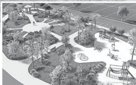
Такой эскиз сквера был представлен при голосовании