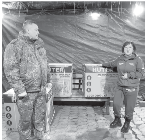
► Передача гуманитарного груза на территории ДНР