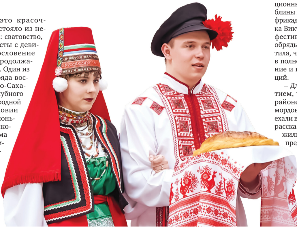
▶ Молодым при входе в дом жениха вручают каравай кошп – как символ продолжения рода