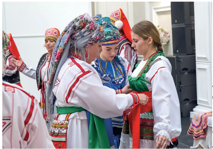
▶ Фрагмент свадебного обряда – наряднение невесты к венцу

Сковороду раскалить, смазать сливочным маслом. Блины выпекаются под крышкой на среднем огне, минуту с каждой стороны. Они должны получиться толстыми, желтоватого цвета. Подавать со сметаной, медом и вареньем.