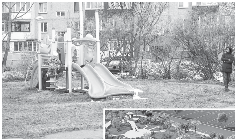
На этом месте создадут новый сквер

– В хорошую погоду, когда забираешь ребенка из детского сада, хочется где-то погулять, а не