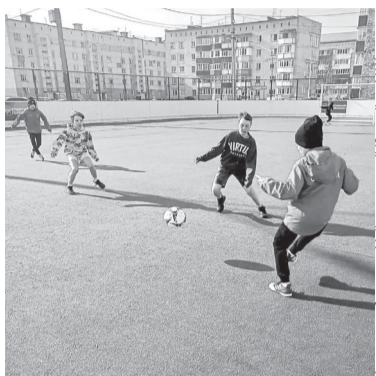
На спортивных кортах дети азартно играют в футбол

Стать участником проекта может любой желающий. Актуальная информация о занятиях размещается в Telegram-канале «Кузница здоровья». Консультации по телефону +7-900-429-16-23.