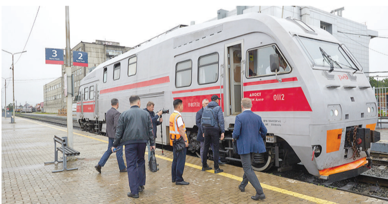
▶▶ Рельсобус готовится отправиться по новому маршруту

Материал подготовлен на основе данных официального сайта администрации Южно-Сахалинска.