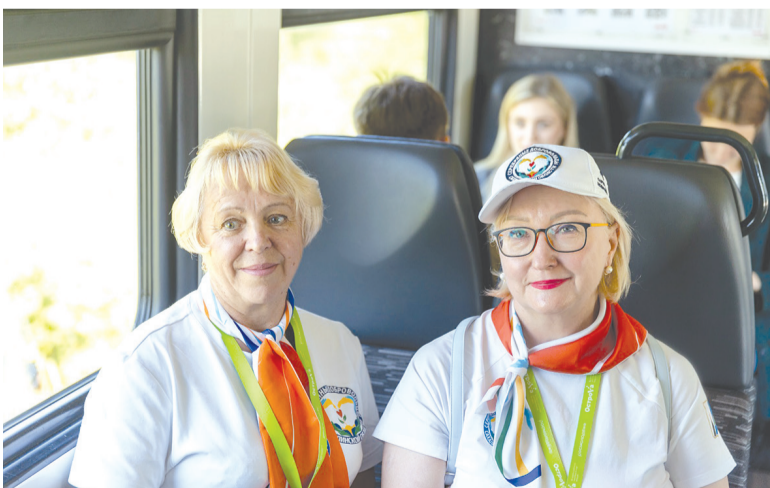
▶▶ В путь!