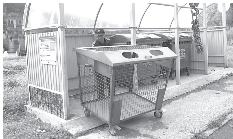
► Сетчатый контейнер для раздельного сбора ТКО

Экологическая сознательность — качество, в котором остро нуждается наше общество. До сих пор проблема мусора в России — одна из наиболее актуальных. Потому и решать ее взялись глобально. Инициатором национального проекта «Экология» в 2018 году стал президент России Владимир Путин. Одно из направлений проекта — комплексная система раздельного накопления и сбора твердых коммунальных отходов. Отмечено, что сортировка ТКО заметно повышает столь необходимую нашему гражданскому сообществу экологическую сознательность. Во всяком случае, в Южно-Сахалинске и населенных пунктах городского округа стало заметно чище. И это несмотря на то, что далеко не все присоединились к процессу, игнорируя призывы сортировать отходы. Однако результаты налицо: раздельный сбор мусора становится хорошей привычкой, которая приносит всем нам ощутимую пользу.