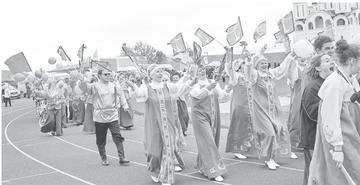
► Поздравляем любимый город!