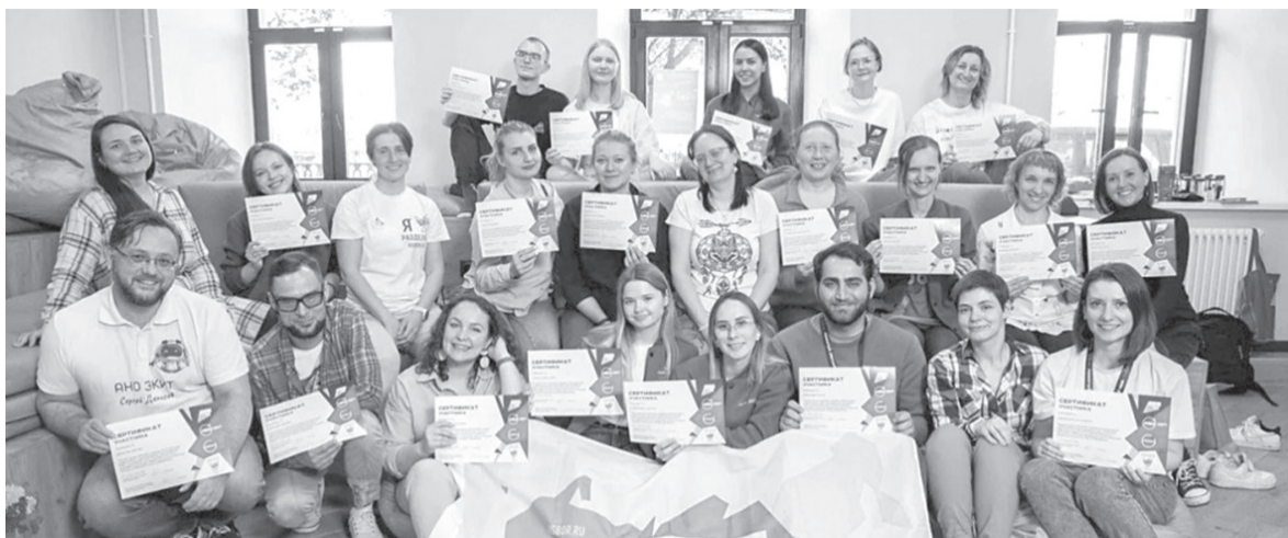
► Команда участников стажировки