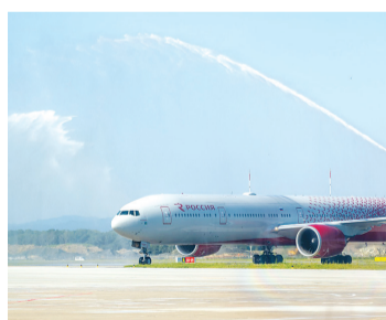
►► Новый терминал первым принял борт из Москвы

— Инвестор реализовал проект по созданию нового аэровокзального комплекса в Южно-Сахалинске в статусе резидента территории опережающего развития «Горный воздух». По соглашению с Корпорацией развития Дальнего Востока вложено около 8 млрд рублей, создано более 400 рабочих мест.