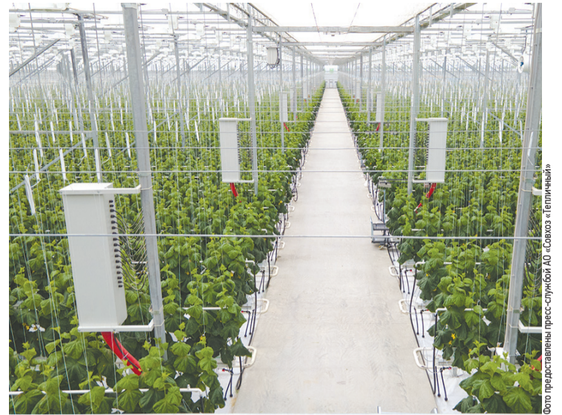
► Современная теплица — сложное инженерно-агротехническое сооружение

— В неорганическом субстрате, на минеральной вате. Для того чтобы получить качественный продукт в достаточном количестве, необходимо так называемое контролируемое выращивание, когда ежеминутно, ежедневно, еженедельно есть возможность следить за процессом. Сегодня производство огурцов на мине-