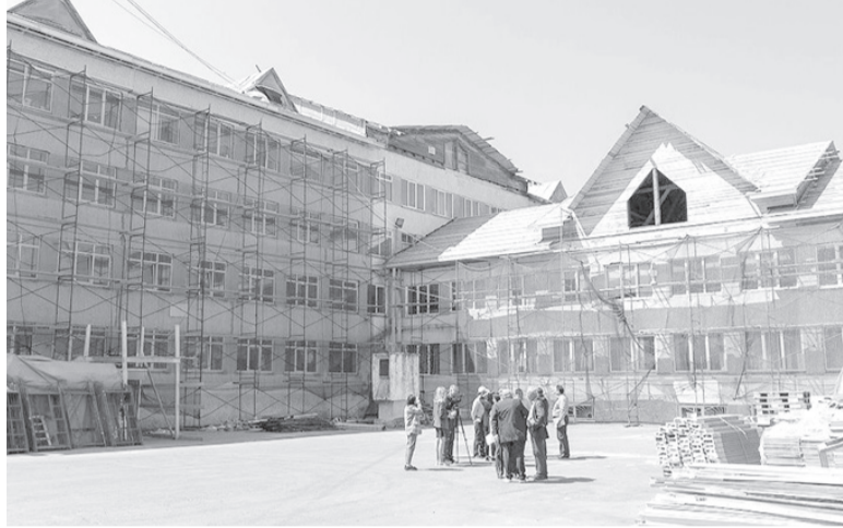
► 1 сентября школа предстанет обновленной

Кстати о дверях. Мэр Южно-Сахалинска Сергей Надсадин тщательно контролирует ход модернизации учебных заведений города в рамках федеральной программы. Во время посещения школы № 3 он обратил внимание на состояние входных групп и крылец с западной и северной стороны образовательного учреждения. В рамках модернизации их ждала только косметическая реставрация. Но мэр подметил, что этого будет явно недостаточно, и поставил задачу разработать проект их капитального ремонта. Крыльца облицуют гранитной плиткой. Средства были выделены в кратчайшие