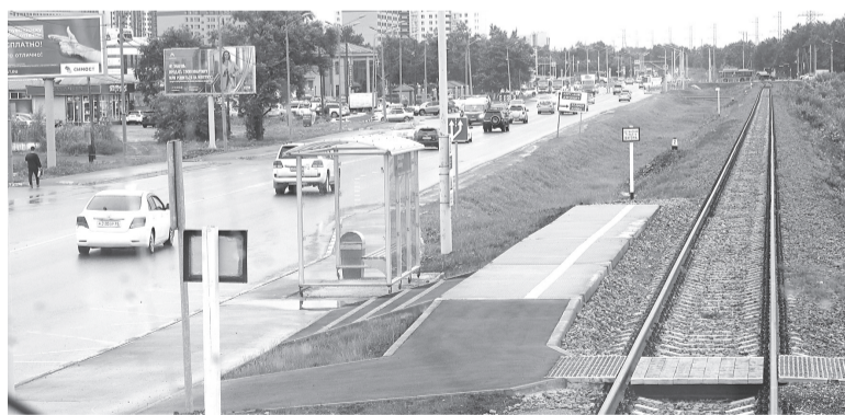
► Совмещенная автобусно-железнодорожная остановка

в период с августа по октябрь. Часть из них предназначена для маршрута № 104, соединяющего центр города с селом Дальним. Третья партия из 25 автобусов среднего класса прибывает в декабре, они заменят устаревшие машины на маршрутах № 71 и 10.