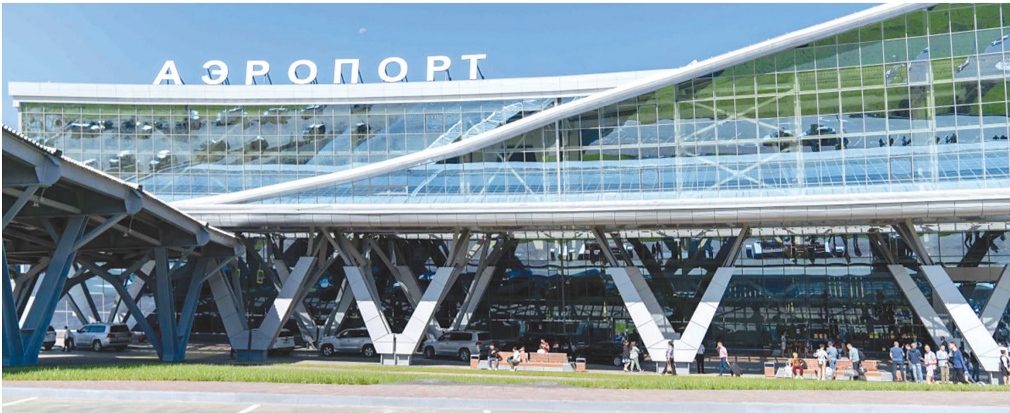
►► Новый пассажирский терминал