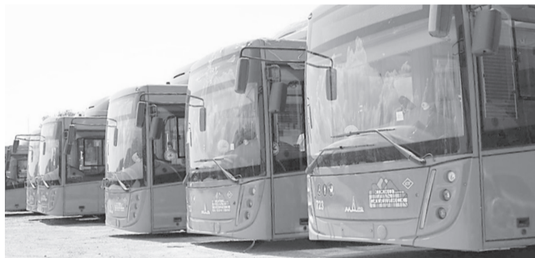
► Пополнение для городского автопарка