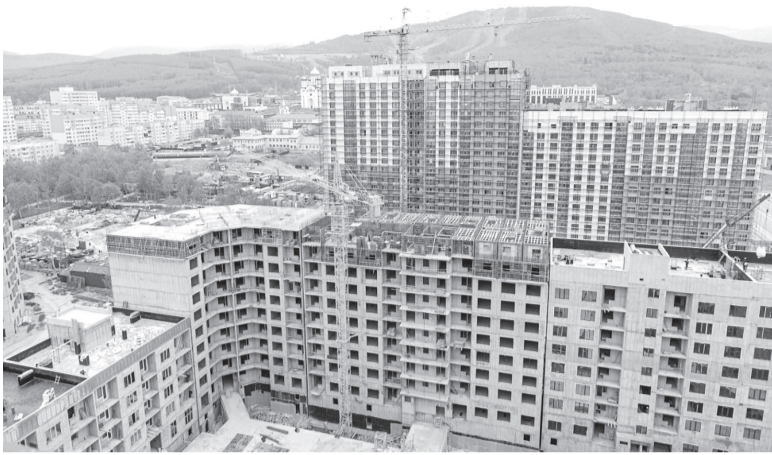
► ЖК «Авангард» растет