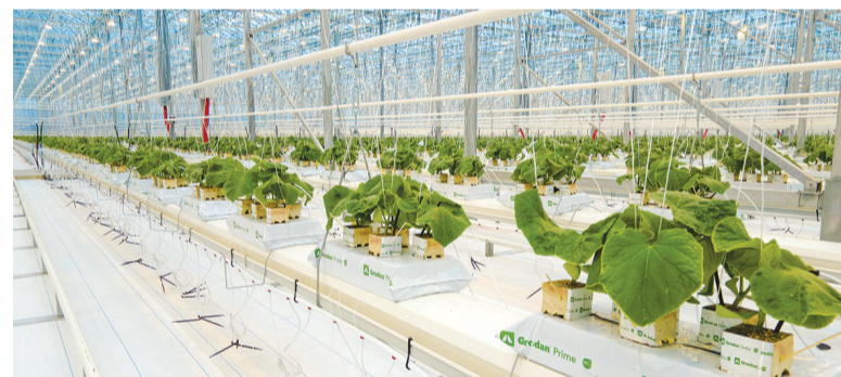
► Огурец пошел!