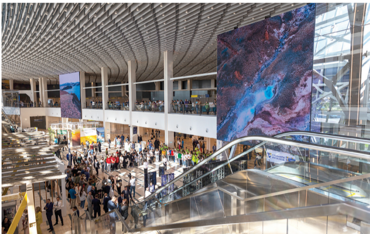
►► Людно в здании аэровокзала

Важнейший для Сахалинской области транспортный объект начал работать в тестовом режиме. Новый терминал способен с комфортом принимать до 5 миллионов пассажиров в год — в 5 раз больше, чем старый. Такие мощности позволяют не только закрыть все текущие потребности, но и создать задел для развития авиаперевозок на годы вперед.