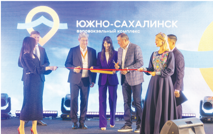
►► Торжественный момент

В островной столице вступил в строй самый современный аэровокзал Дальнего Востока