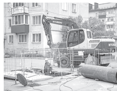
► Ремонт в разгаре

Бюджет ремонтной програм- мы СКК составил около 200 млн рублей. План летних мероприя- тий традиционно включает в себя такие пункты, как капитальный ремонт зданий и сооружений теплосетевого комплекса, магистральных трубопроводов, ремонт обо- рудования, обновление тепло- изоляции сетей. Отдельная строка — восстановление