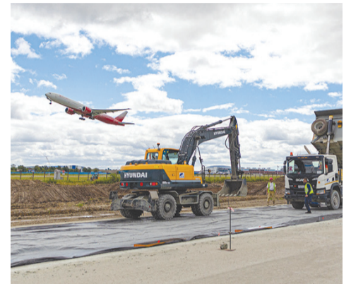
►► ВПП планируется сдать в 2024 году

Строительство новой взлетно-посадочной полосы получит существенное финансирование