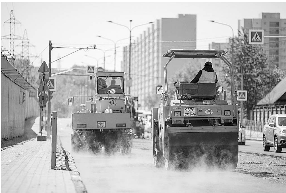
■ В СЛЕДУЮЩЕМ ГОДУ бюджетные средства также будут направлять на ремонт дорог