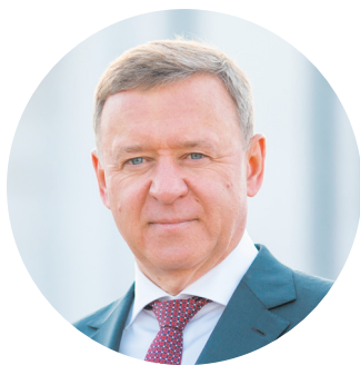
Сергей НАДСАДИН, мэр города Южно-Сахалинска.

Убежден, что самые талантливые и активные ребята живут в нашем городе. От всего сердца желаю вам счастья, крепкого здоровья, оптимизма и хорошего настроения! Пусть вас каждый день окружают родительская любовь и забота, а предстоящее лето будет наполнено яркими событиями и незабываемыми впечатлениями!