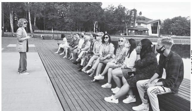
Лекции можно проводить и на открытом воздухе.