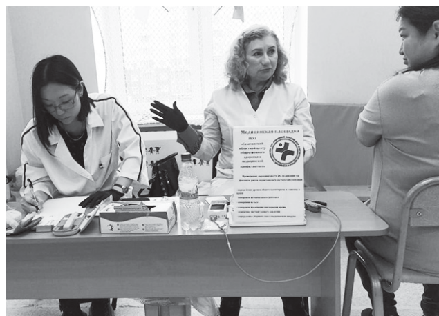
Медицинская площадка в детском саду «Ягодка».