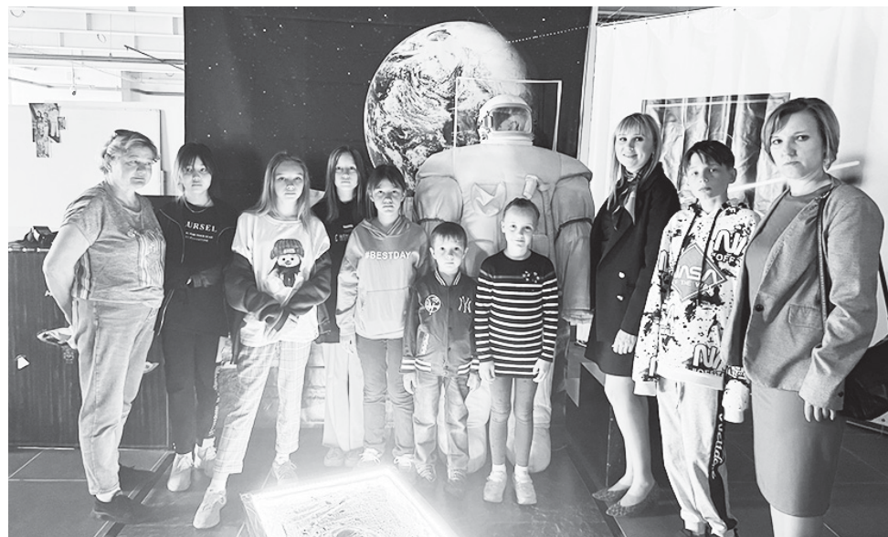
Перед началом экскурсии в «Космодрайв».