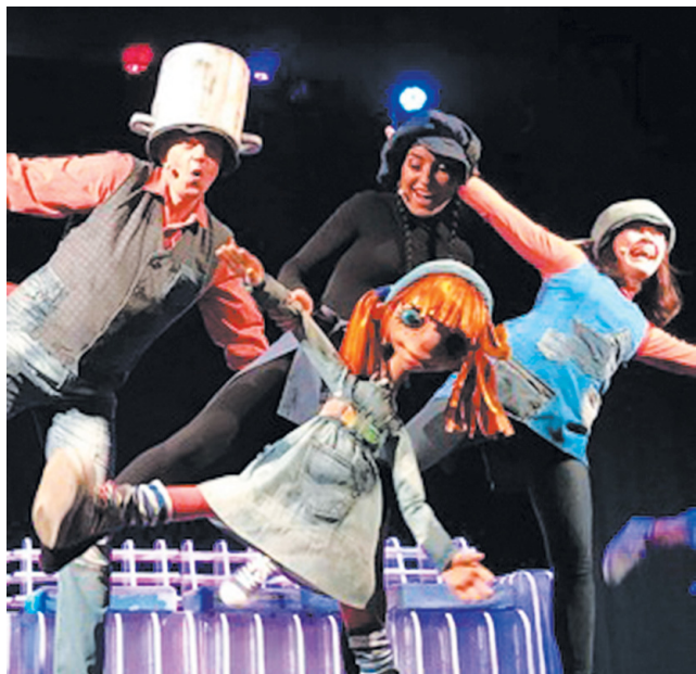
Сцена из спектакля «Мы летели на диване».

Когда я пришла в театр на интервью, в большом зале только что закончился спектакль «Урок памяти «Помним!», посвященный 77-й годовщине Великой Победы.