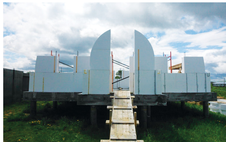
Сборка пенопластовых стен.