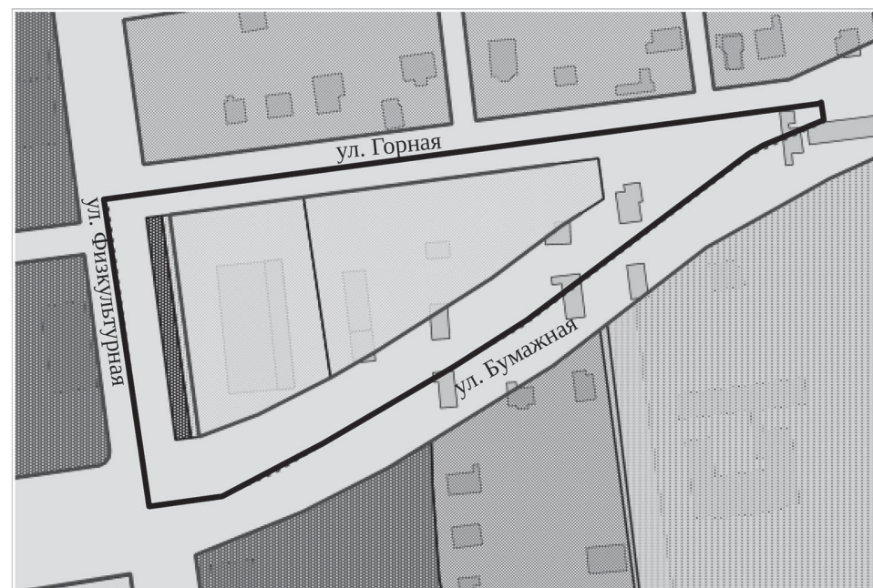
границы проектируемой территории

Приложение к постановлению администрации города Южно-Сахалинска от 15.03.2022 № 497-па Схема границ проектируемой территории