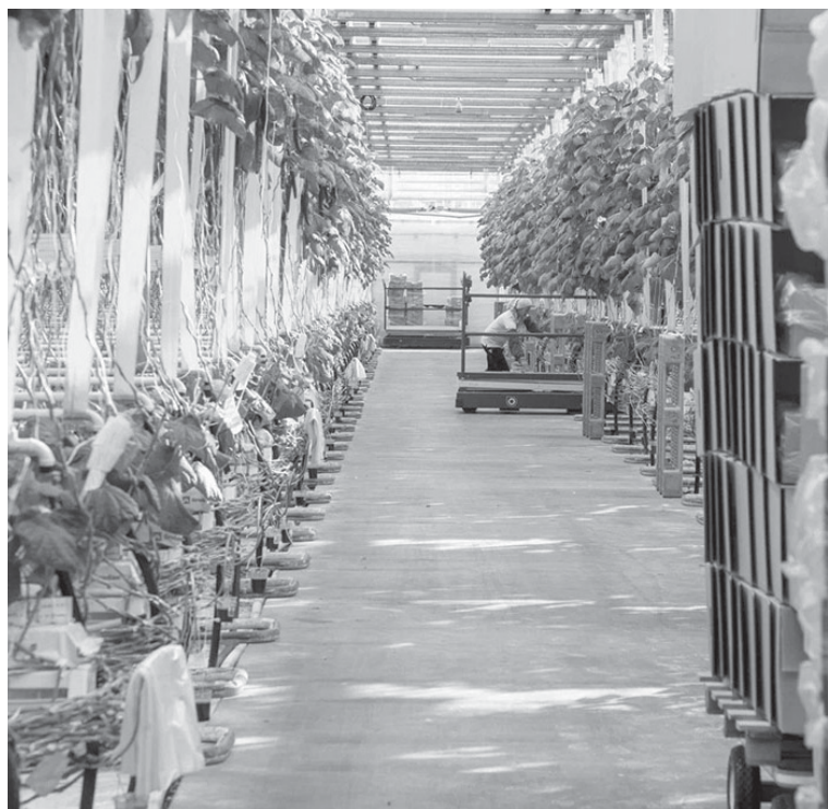
■ ЗРЕЕТ новый урожай.

Являясь резидентом ТЕР «Южная», совхоз «Тепличный» за несколько лет реализовал масштабный проект по строительству теплиц, создав условия для отказа от завоза на острова овощей закрытого грунта. Проведена большая работа по созданию в Южно-Сахалинске крупнейшего на Дальнем Востоке предприятия по производству такой продукции с применением современных технологий. Автоматизированный комплекс заменил 6 гектаров устаревших теплиц, построенных в