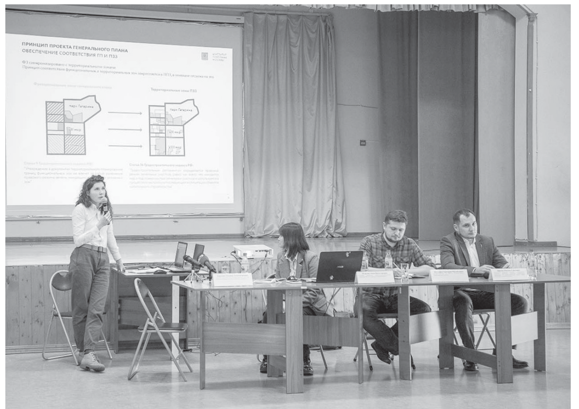
■ ВО ВРЕМЯ ОБСУЖДЕНИЯ важнейших для южносахалинцев градостроительных документов.

Предложения по Генплану южносахалинцы могут вносить до 28 апреля включительно.